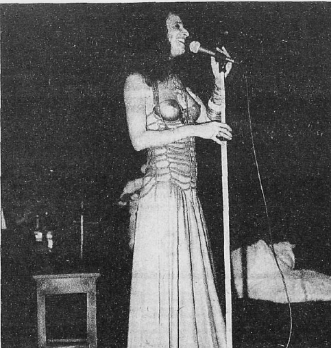
"No palco eu fuço de tudo, sapateio, ando na corda bamba, danço, caio, o palco é meu".

M ARIA Bethânia conseguiu esse ano atingir uma marca que dificilmente outra cantora brasileira conseguirá dobrar: "Alibi", o seu novo elepe, já vendeu 800 mil cópias e do jeito como está indo, até o final do ano, não será surpresa vender a casa de um milhão de discos vendidos, se detendo super apenas por Roberto Carlos. Até para ela é difícil explicar tamanha popularidade, mas é evidente que tem consciência do seu esforço, da sua dedicação, da forma persistente com que sempre procurou fazer o que sabia, mesmo tantas vezes criticada por não violentar a uniformidade dramática que veste a cantora e atriz. "Eu não abri mão da minha verdade", é a resposta simples, lacônica, mas profundamente sincera, que encontra para tentar explicar a razão da ampla aceitação que vem tendo. E foi sempre perseguindo esta verdade interior que ela — considerada então uma cantora exclusiva da elite da zona sul — "Arrombou a festa" também no subúrbio, fazendo centenas de suburbanos detraírem com o seu canto e seus trejeitos no Teatro Cine Show Madureira, no Rio, o que valeu mais um título em 16 anos de carreira: "Miss Madureira". É esta a cantora que estreou ontem e permanece em cartaz até o próximo domingo no Teatro Castro Alves, com o show "Alibi".