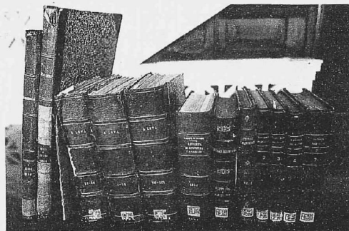
A rica biblioteca do IGHB está a reclamar cuidados e recursos