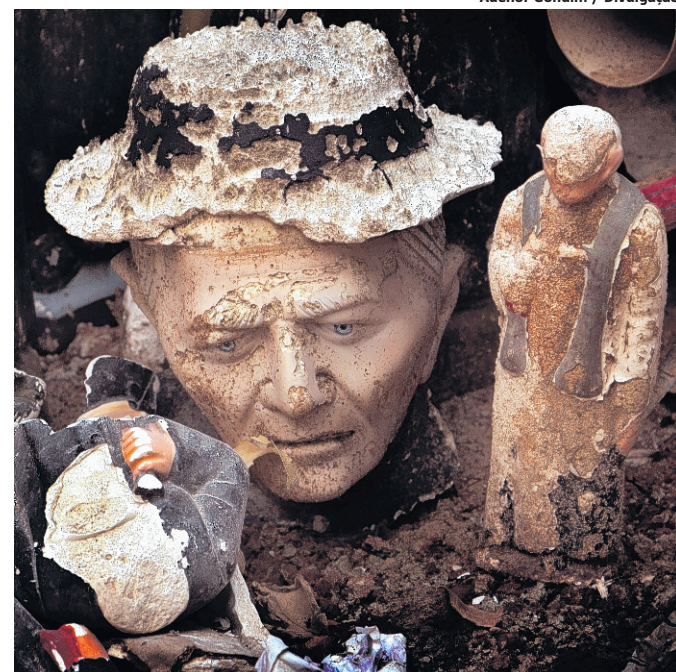
Os Santos, foto de Adenor Gondim que integra exposição

“Mesmo que muitos fotógrafos atuais não se considerem herdeiros, eles tiveram certa influência do antropólogo e fotógrafo francês”