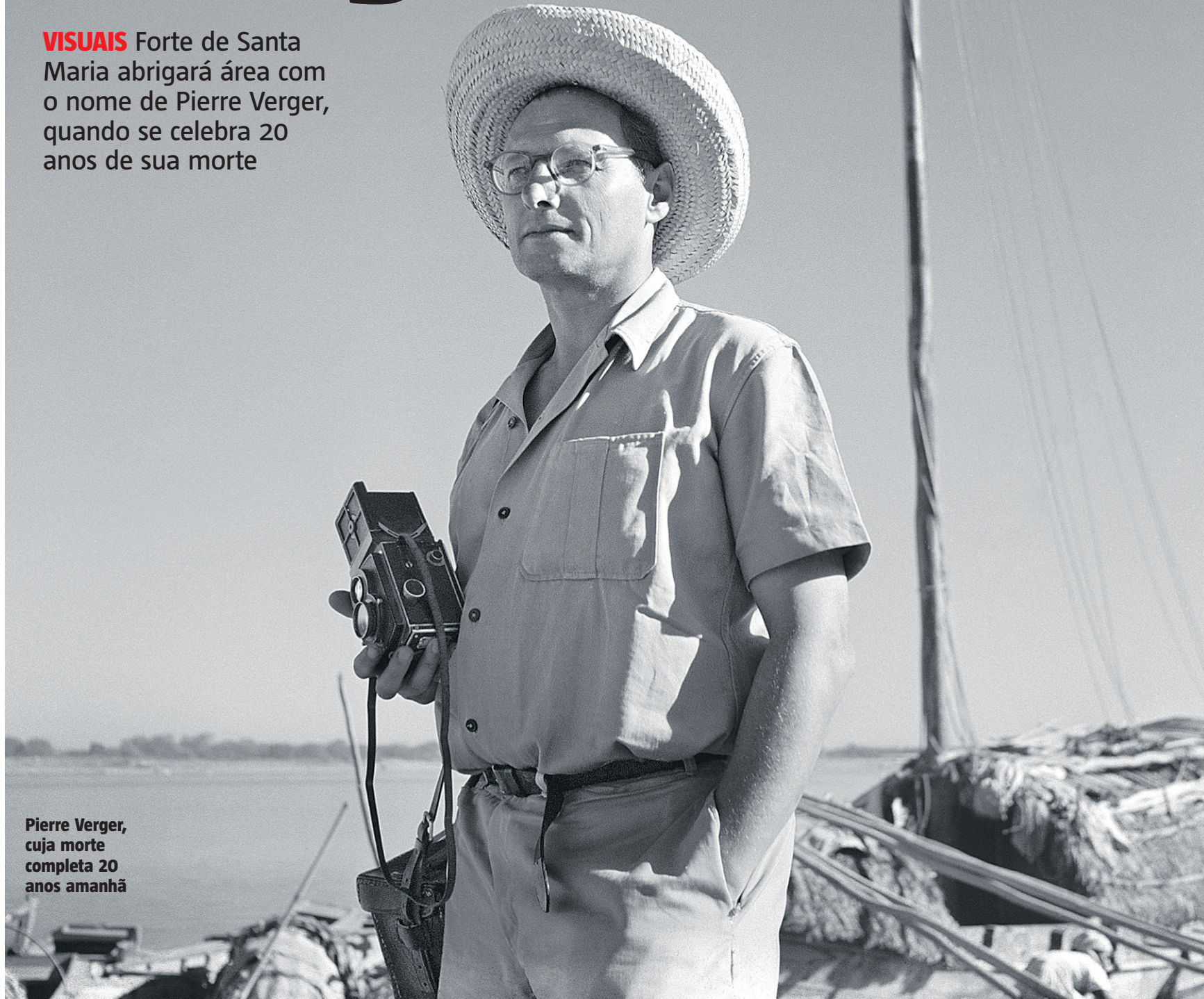
Pierre Verger, cuja morte completa 20 anos amanhã

VISUAIS Forte de Santa Maria abrigará área com o nome de Pierre Verger, quando se celebra 20 anos de sua morte