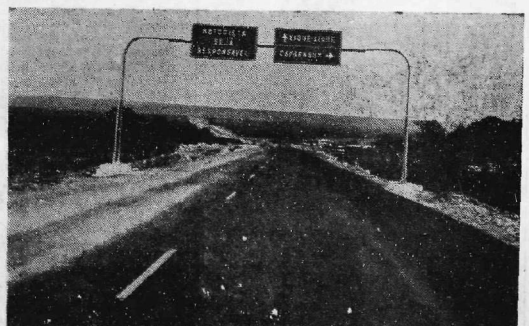
Inaugura-se a "Estrada do Feijão"

O Ministro do Interior, General Raul Benevides, disse, em mensagem ao país, que uma lista dos primeiros 100 prisioneiros beneficiados com a medida seria entregue, imediatamente, à Cruz Vermelha Internacional e a outras organizações, para facilitar a viagem dos libertados ao Exterior.