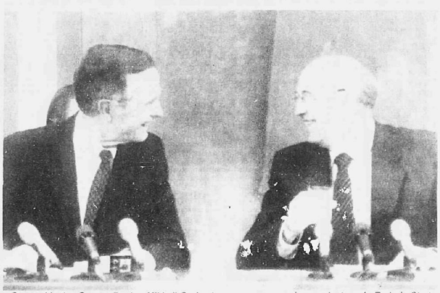
Os presidentes George Bush e Mikhail Gorbachev conversam após a assinatura do Tratado Start

O Tratado Start, primeiro a reduzir os arsenais nucleares estratégicos dos Estados Unidos e da União Soviética, foi assinado, ontem, pelos presidentes George Bush e Mikhail Gorbachev. Segundo o líder soviético, "este acordo desmantela a infra-estrutura de medo que dominou o mundo". Ele previu, entretanto, dificuldades para a ratificação do tratado pelo Senado norte-americano e pelo Parlamento soviético. "O acordo deve ser defendido das críticas que receberá dos conservadores, que julgam excessivas as concessões dos negociadores, e dos que não se acham suficientes". Já Bush considerou o tratado como "o mais importante dos contratos que regem o tema de laminação preocupação". (Pag. 11)