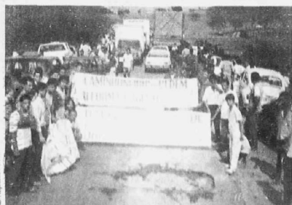
Moradores de Ilhéus, revoltados, interditiaram a Bahia-Brasília