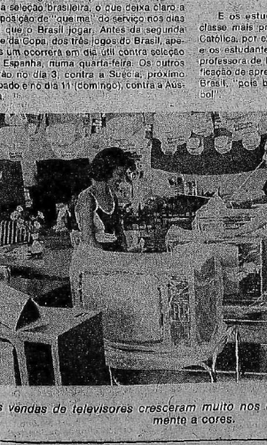
Vendas de televisores cresceram muito nos últimos dias, principalmente em cores.

De qualquer forma, os planos vão tomando forma em cada pessoa. O "Jelinho" do brasileiro nunca falha e não é nesta hora que ele não surtia. Há gente falando que culpa o trânsito, escolheira a hora do jogo para mentir, ficaria doente ou "mataria um pai". Enquanto isso, o movimento de venda de televisores a crédito continua ultrapassando as expectativas de todos os gerentes. A preferência maior tem sido por aparelhos em cores e rádios com faxas FM, por sinal já em falta na praça.