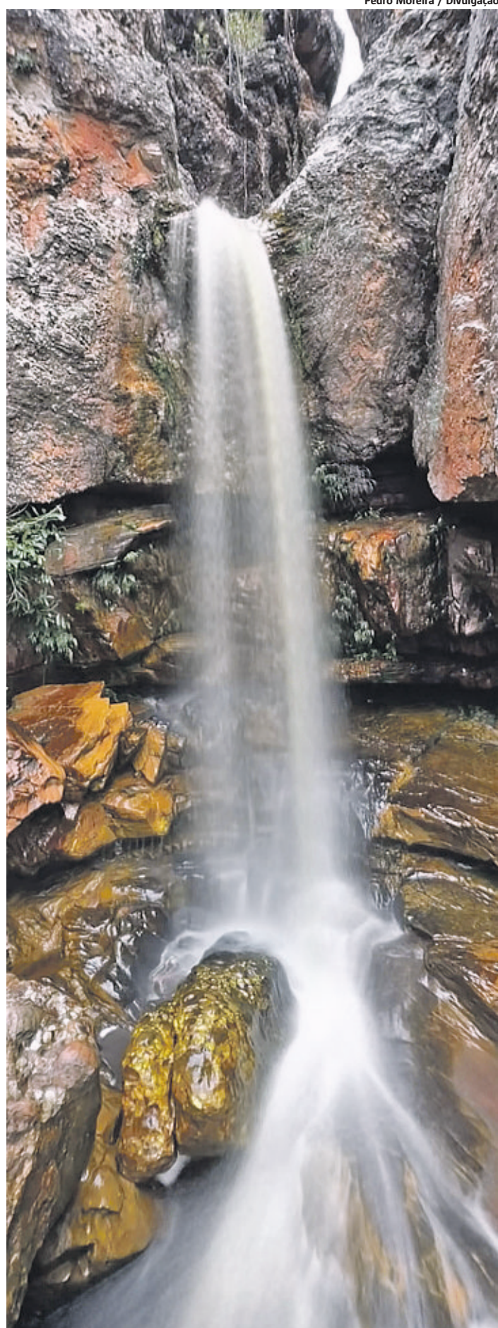
Parque Natural de Muritiba, localizado no município de Lençóis

destino consolidado, de onde partem as caravanas para boa parte das trilhas e passeios aos atrativos da região.