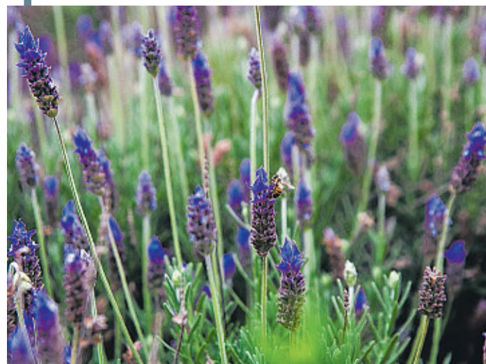
A lavanda é usada na produção de óleos essenciais

Esta é a rota mais diversa entre as três novas opções turísticas que a região está oferecendo, porque despertam sensações e emoções com experiências únicas que aguçam diversos sentidos como o sabor, o aroma, o visual e o contato com a cultura local em um só lugar: o município de Morro do Chapéu. A mil metros de altitude com uma temperatura amena que pode chegar a oito graus no inverno, aliadas ao rico acervo natural e uma diversa fauna e flora conferem à região um “terroir” ideal para diversos cultivos.