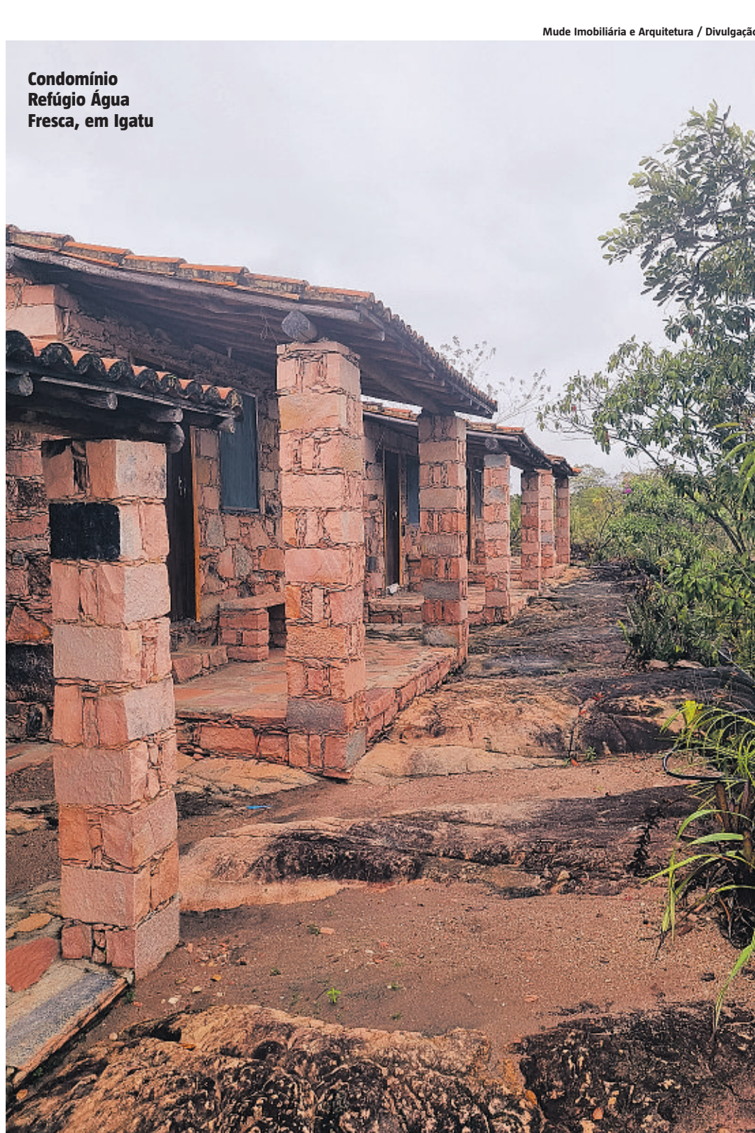
Condomínio Refúgio Água Fresca, em Igatu