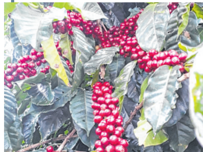
A Chapada possui cafés gourmets e especiais reconhecidos

A Chapada Diamantina possui uma produção reconhecida de café gourmet e especial, categorias da bebida e dos grãos considerados de altíssima qualidade, orgânicos e biodinâmicos, com destaque no Brasil e no mundo, e vencedores de diversos prêmios em concursos nacionais e internacionais de café.