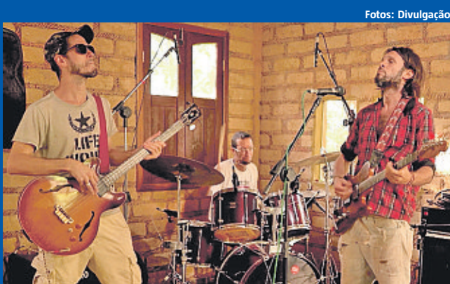
A banda local Candombá Blues é atração no primeiro dia