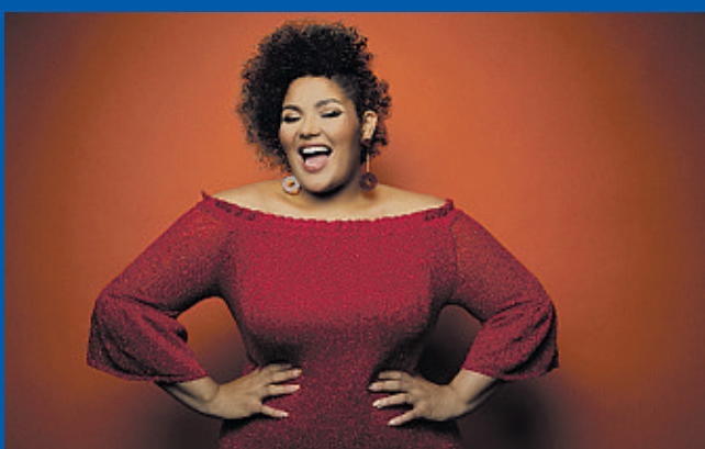
A norte-americana Alma Thomas participa como convidada