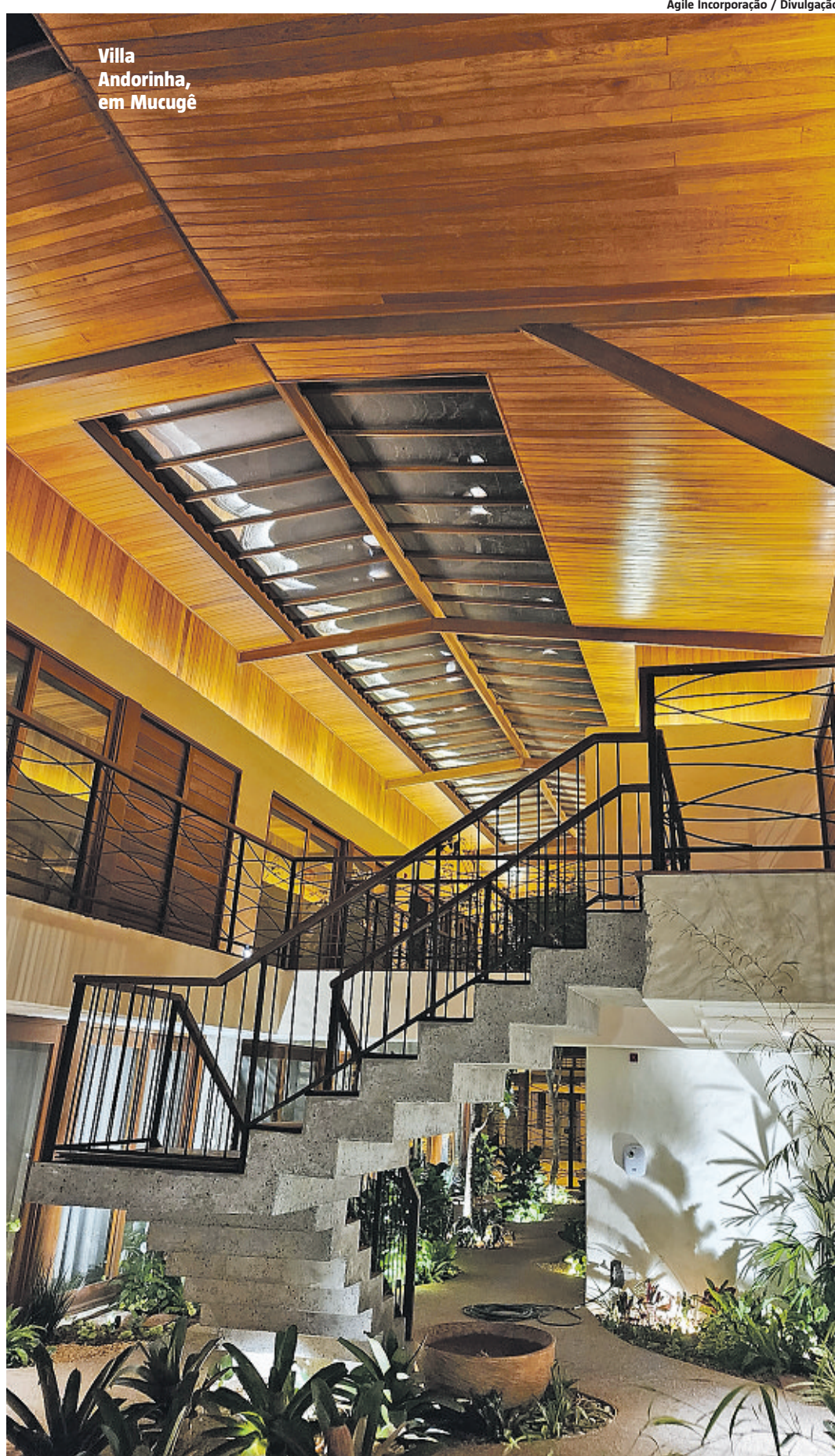
Villa Andorinha, em Mucugê

Como consequência do crescimento imobiliário na Chapada Diamantina, o consultor imobiliário ressalta que projetos e investimentos em paralelo estão surgindo, a exemplo do estudo para a criação de uma marina na