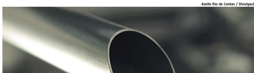
Azeite Rio de Contas / Divulgação

“Aqui, no nosso pomar, metade das árvores nunca produziu e a outra metade produz uma vez a cada três anos. A gente ainda está muito longe dos padrões alcançados no Rio Grande do Sul e na Europa, onde cada pé costuma produzir cerca de 20 kg de azeitona por