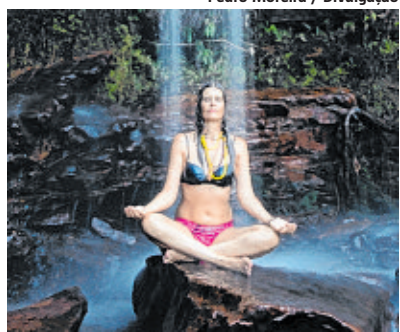
O ecoturismo é vocação natural dos municípios chapadeiros