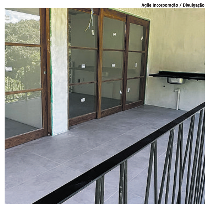
Diamantino Residence, em Mucugê, deve ser entregue até julho