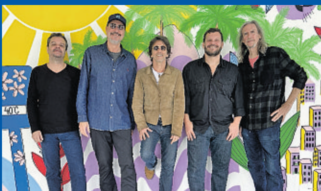
Blues Etílicos, do Rio de Janeiro, marca presença no evento