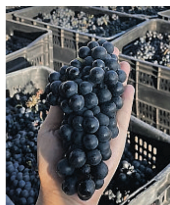
Uvas cultivadas na Chapada viram vinhos e espumantes

O empresário conta que a Vaz nasceu com o desafio de produzir vinhos e espumantes na Chapada Diamantina para compartilhar as experiências do prazer que a vida no campo proporciona por meio da vitivinicultura. Foi com este propósito que concebeu o projeto Enoturístico da Vinícola, permitindo os visitantes conhecerem e participarem das atividades vitícolas, com visitas guiadas e