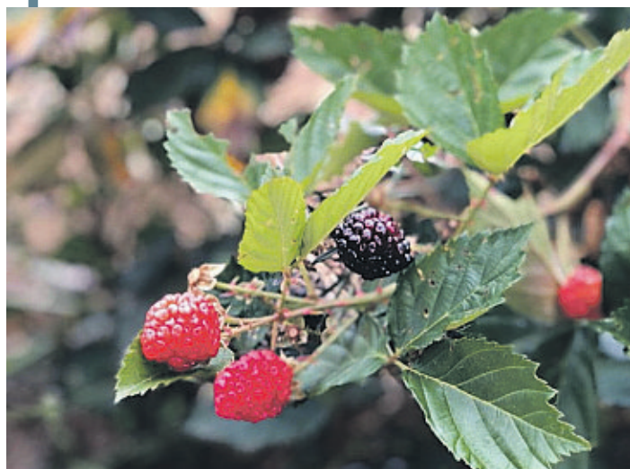
As amoras estão entre as frutas cultivadas na região

Parece inusitado ver frutas vermelhas como morangos, amoras pretas, framboesas e mirtilos (blueberry) sendo cultivadas com sucesso em meio a uma vegetação de caatinga. É que a Chapada tem um clima próprio. A elevação dos municípios com mais de mil metros acima do mar gera um ambiente propício às frutas temperadas, chegando a fazer frio de 19 a 3 graus no inverno.