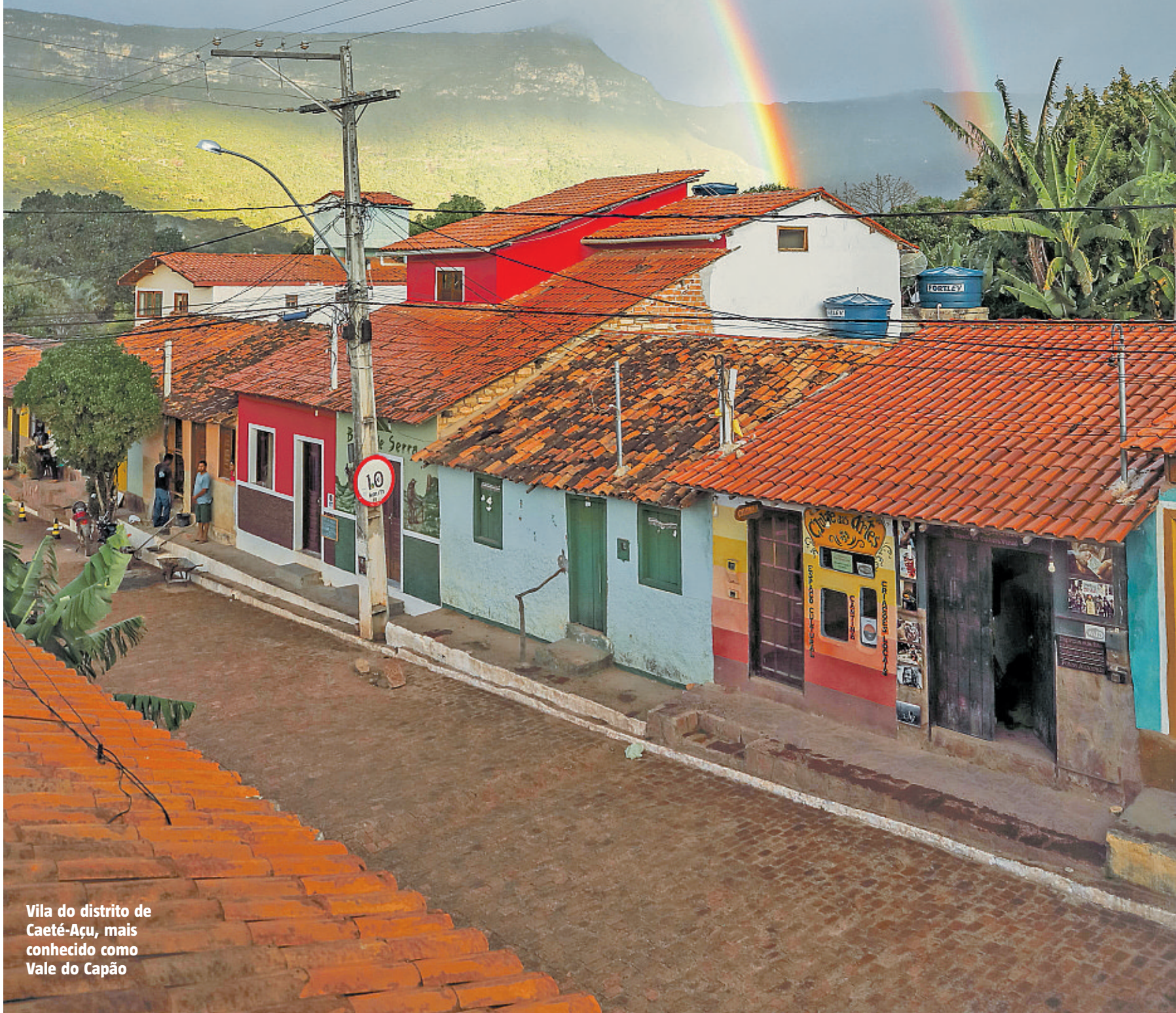
Vila do distrito de Caeté-Açu, mais conhecido como Vale do Capão