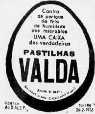
Contro de perigos de Humidade e de Umidade