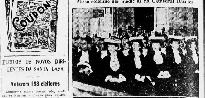
Missa solenne dos medicos na Cathedral Basilica