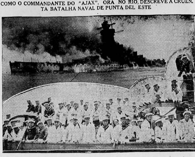
O "GRAF SPEE" presa das charrmas que o destruíram, ao Inazo de Montevideo, usando-se em baixo a "sua tripulação a bordo do "Tacoma"

RIO, 13 (Para a A TARDE por via aere). — O commandante do cruzador inglês Ajax, ora ancorado no Rio, descreve á republianos, o seguinte relato das occurencias que culminaram com o afundamento do "Graff Spee", por sua propria tripulação, descrição do combate e do plano proprio commandado do "Ajax", capitão Woodhouse: