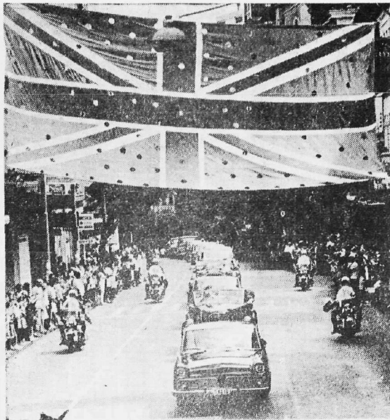
Para compensar a falta da ornamentação de praxe nos postes da Avenida, grandes bandeiras da Inglaterra foram colocadas em pontos do itinerário percorrido por Sua Majestade. Há via uma delas (foto) em São Bento. No momento em que por ali passou o cortejo, Elizabeth II ergueu os olhos e contemplou o pavilhão de sua pátria. O povo aplaudiu.