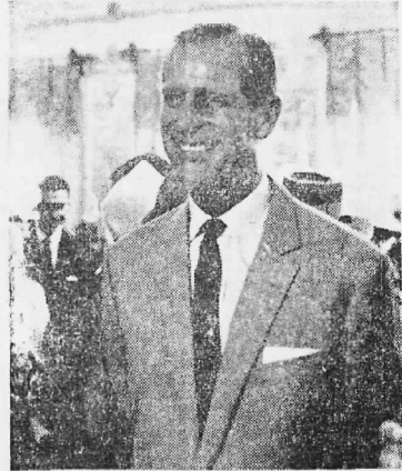
O Príncipe Philip, em close-up. Bem humorado e esprituoso, o Duque de Edimburgo mostrou-se postado da Bahia e das pessoas com quem aqui esteve. Aliás, é a segunda vez que veio a Salvador (a primeira foi em 1952). Suas sobranceiras crespas duram e que falar à moçada baiana.