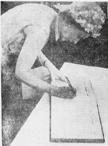
Elizabeth II deixou no livro de visitantes do Clube Inglês algumas palavras sobre o quase centenário centro de reuniões dos nobres britânicos em Salvador. Há alguns anos, ela mandou ao Clube um retrato seu autografado, que figura no salão principal.