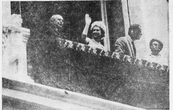
Esta é uma foto que não deverá repetir-se durante a atual excursão da Rainha Elizabeth à América do Sul. Foi o que nos informou um dos assessores da Embaixada Inglesa no Brasil. Somente na Bahia (porque o Palácio de Aclamação é o único que tem escada, dando diretamente para a via pública), a soberana autorizou que programassem o seu aparecimento para agradecer expressamente as manifestações. A comitiva aconteceu com certa freqüência no Palácio de Buckingham, em Londres. Aparecendo na sacada do Aclamação, em companhia do Duque de Edimburgo, do Governador e Sr. Luis Viana, a Rainha agradeceu aos aplausos da multidão postada em frente do Palácio.

Desde a saída do Cortejo Real do Palácio de Aclamação até a Igreja de São Francisco, passando pela Avenida Sete, não cessaram os aplausos e em alguns edifícios de São Pedro e da Rua Chile, foi jogada grande quantidade de confete branco.