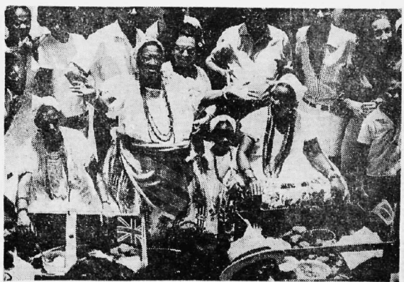
A participação popular foi uma das notas mais significativas e autênticas da recepção da Bahia à monarca dos ingleses. Essa participação ocorreu principalmente no Mercado Modelo e arredores. Ali, baianas genuínas, com seus traços característicos, armaram um "samba de roda", que reuniu muita gente e esteve animadíssimo.