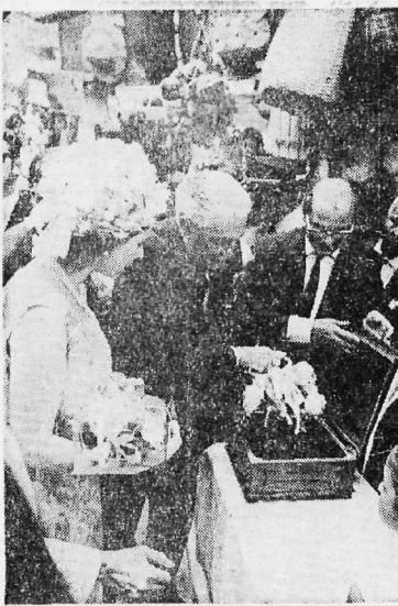
No Mercado Modelo, a Rainha foi presenteadas pelos barraqueiros com uma penca de balangandãs. Os pequenos comerciantes pediram ao Governador Luis Viana que entregasse o presente e explicasse à soberana o significado das várias peças que compõem o balangandã (de prata). Elizabeth manifestou-se contente com o presente, que figurará como elemento de decoração num dos palácios reais.