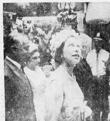
Os artigos de artesanato baiano pendurados no Mercado Modelo atraíram a atenção da Rainha da Inglaterra, que os apreciou demoradamente. Havia penas, mocós, cestas, chapéus de couro, etc. A foto é desses momentos da curiosidade real. A Rainha aparece ao lado do Prefeito do Salvador, Sr. Antônio Carlos Magalhães e senhora.