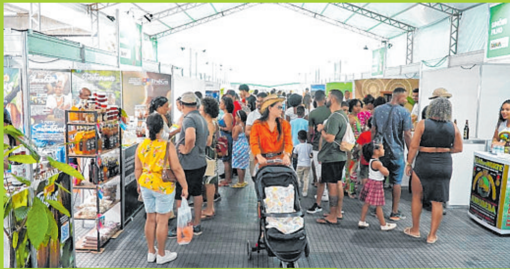
Corredores lotados na Feira das Feiras, para ver municípios como Simões Filho (estande à direita)