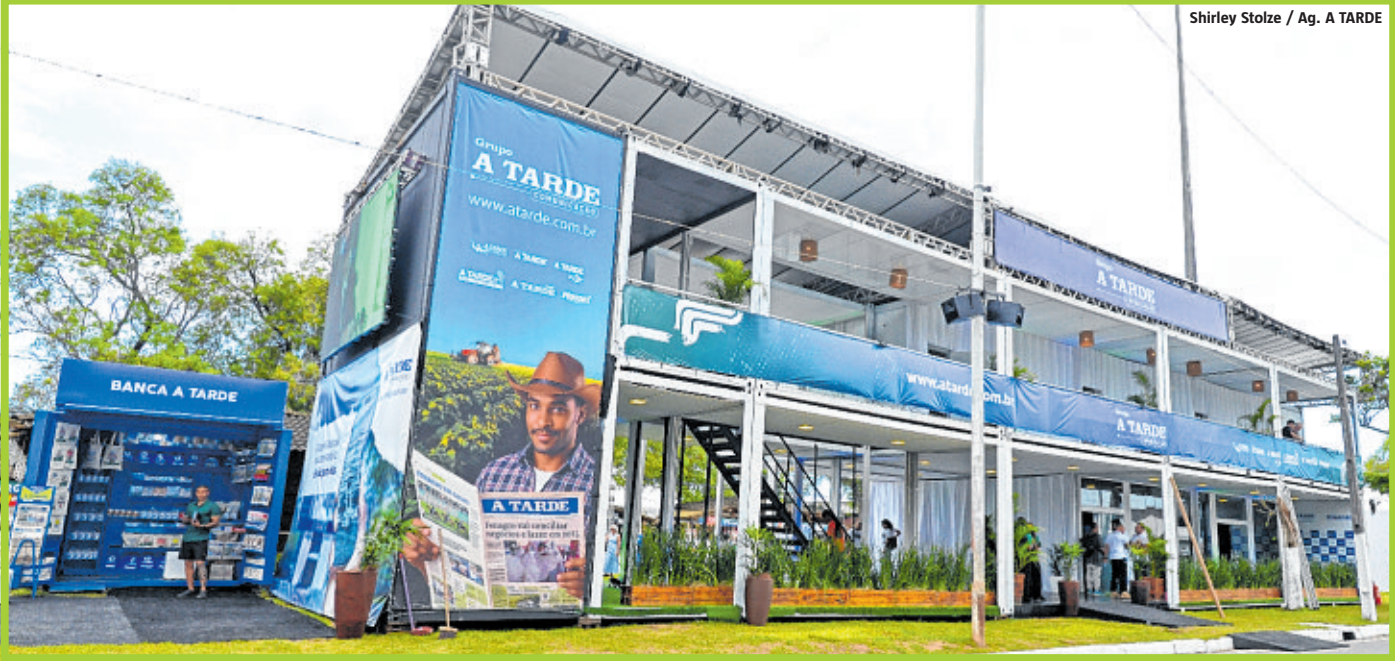
A Casa A TARDE foi um espaço projetado para abrigar a produção de conteúdo, oficinas educativas e receber convidados da Fenagro