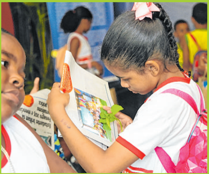
Alunos do Centro Educacional Professor Emerson Palmeira, de Lauro de Freitas