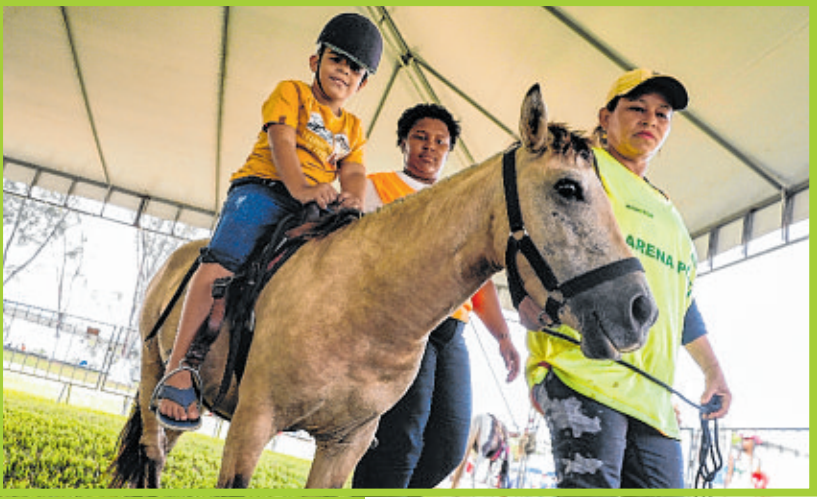
Montaria guiada em cavalos e pôneis é atração consolidada na Fenagro e agrada 100% ao público infantil