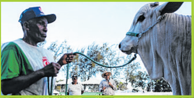
Tratadores se dedicaram para levar animais em perfeito estado à feira