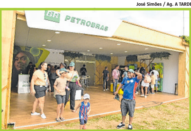
Petrobras anunciou retorno ao setor de fertilizantes durante a Fenagro