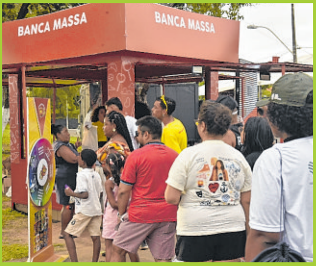
Distribuição de brindes na banca do jornal Massa! rendeu fila durante todos os dias