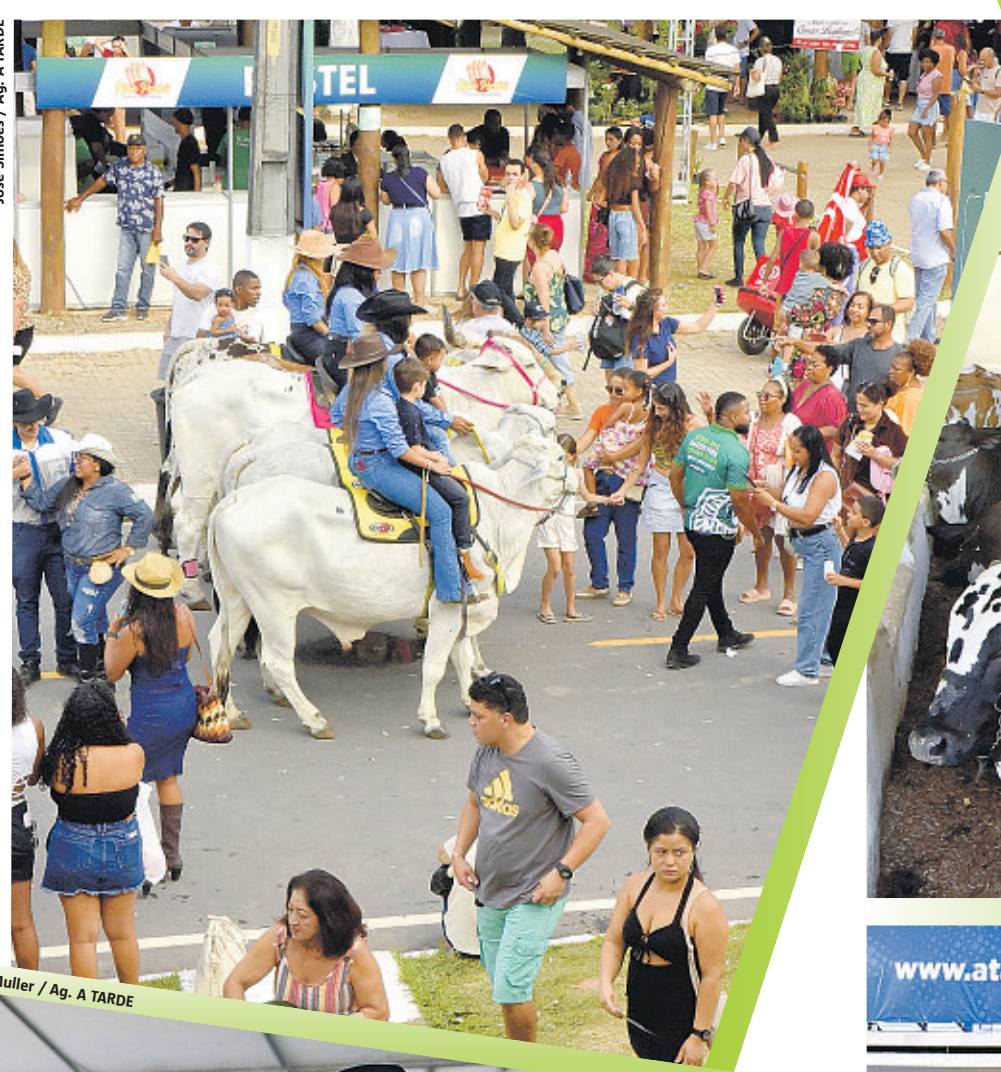
José Simões / Ag. A TARDE