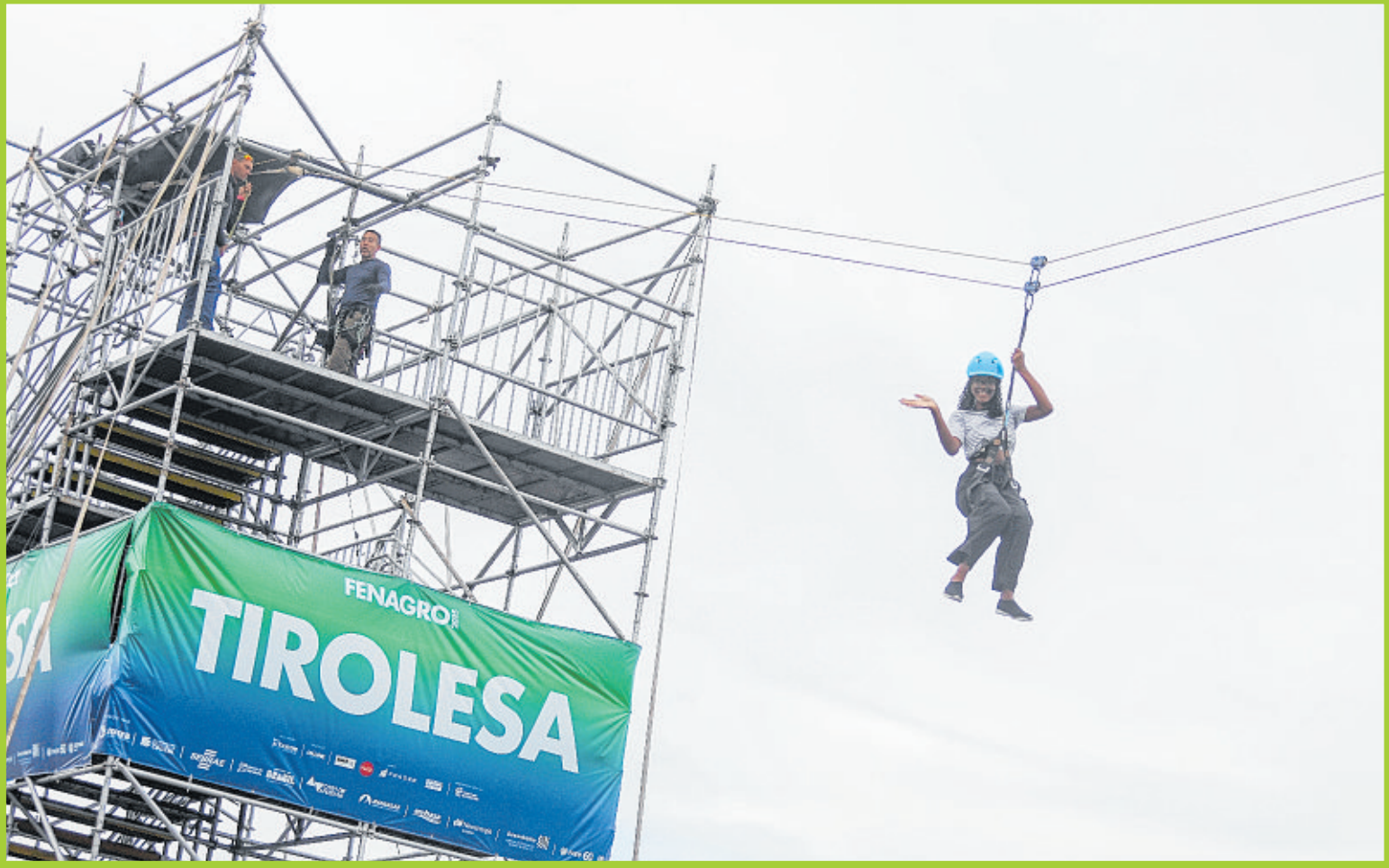
Sucesso total nessa edição da feira, a tirolesa foi o local apropriado para quem curte lazer com fortes emoções e total estrutura de segurança