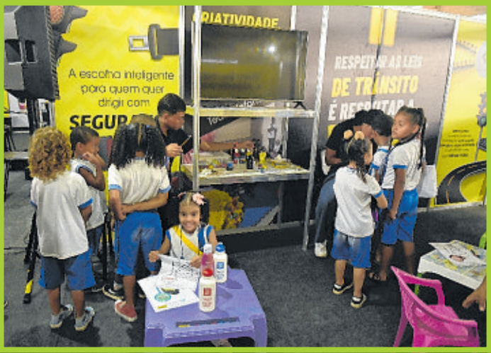
Estande do Detran-BA ofereceu educação para um trânsito mais seguro