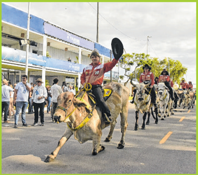
Exibição da Companhia de Bois Adestrados encantou o público da Fenagro