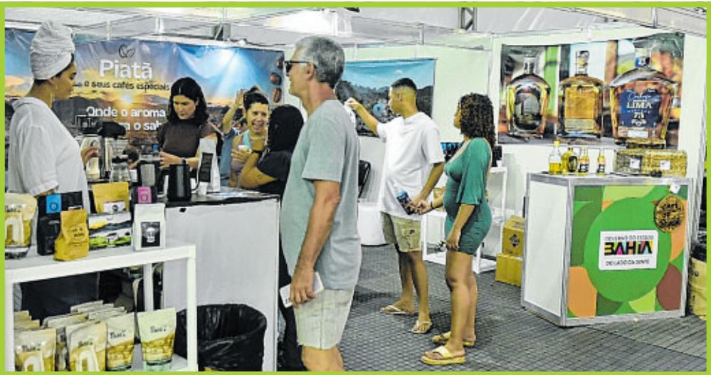
Houve grande demanda por cafés especiais e premiados no espaço reservado a Piatã (Chapada)