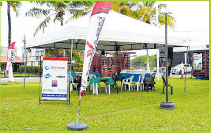
Balanças Argos: produtos certificados pelo Ibama para fazendas