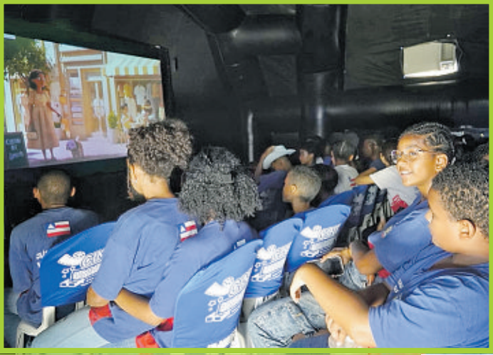
Cotton Cine, da Abapa: filme mostra crianças da cidade que vão ao 'novo mundo' do campo