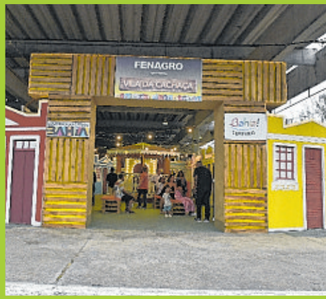
A tradicional Vila da Cachaça é um dos pontos de encontro mais procurados da Fenagro