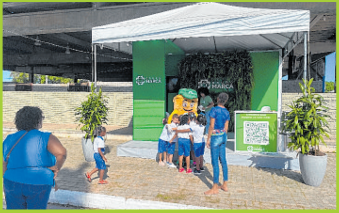
Marca Ambiental: referência em gerenciamento sustentável de resíduos