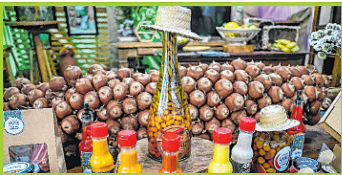
No espaço de Miguel Calmon, os destaques foram os molhos e geleias apimentadas