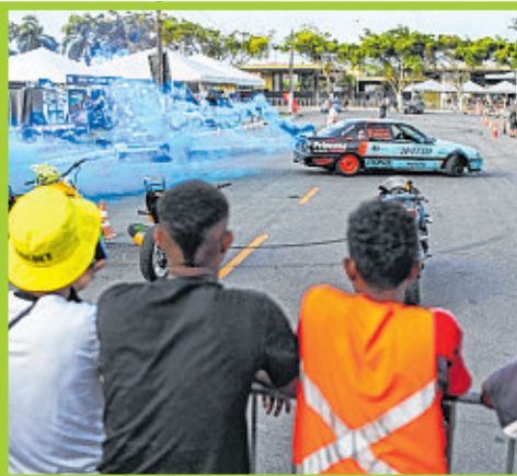
Houve exibição de manobras radicais com carros e motos para liberar adrenalina do público