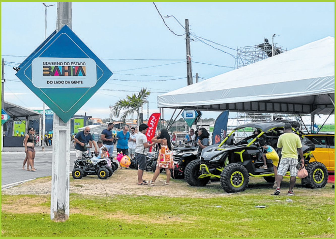
Governo da Bahia foi o principal parceiro do Grupo A TARDE na realização da Fenagro 2025