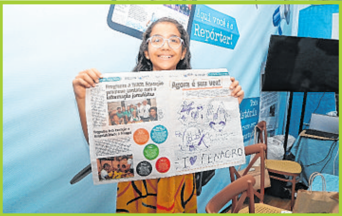
Agência Expressa produziu o jornalzinho da Fenagro: vivências de educomunicação