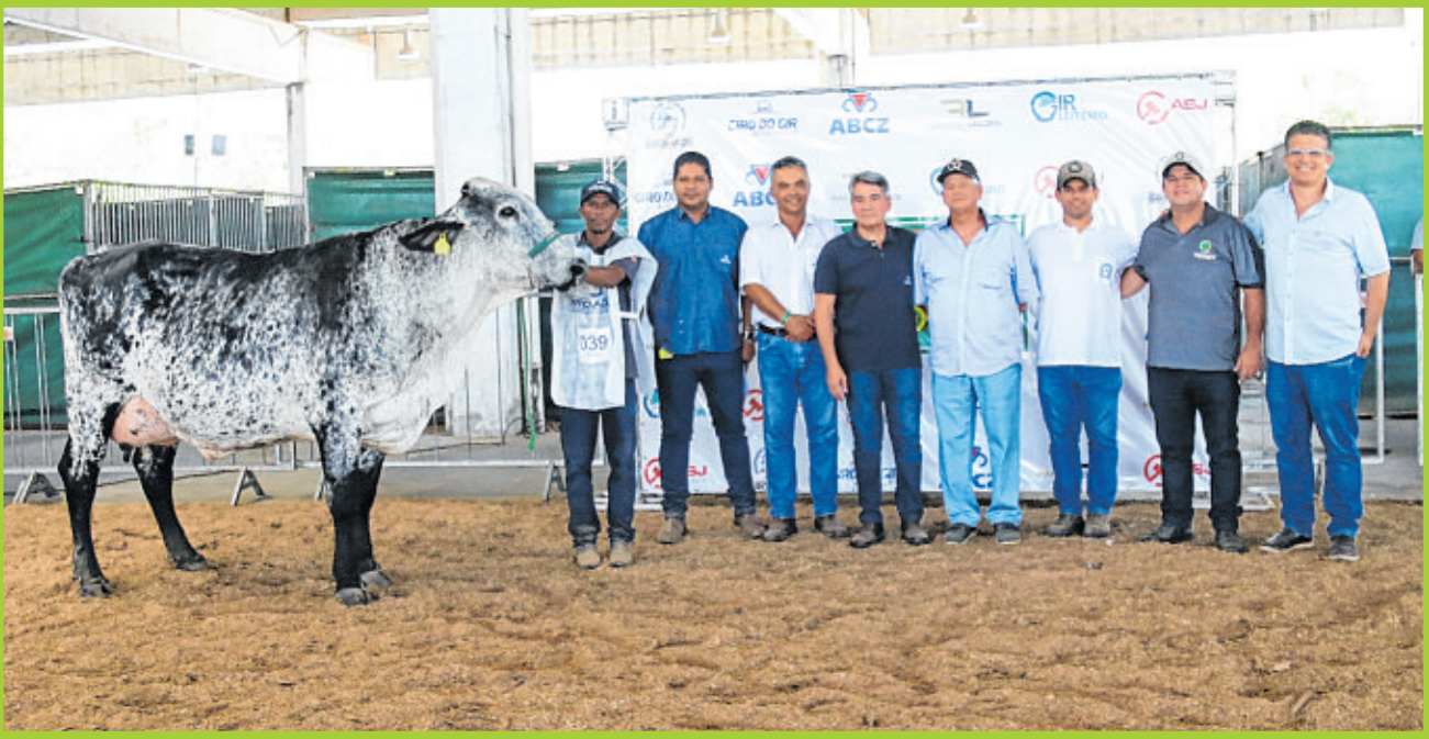
Grande campeã da raça leiteira Girolando, com criadores e juizes da prova