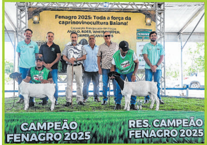
Ovinos campeões da raça Dorper, na categoria Ovino Futuro Menor