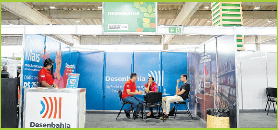
Desenbahia: linhas de crédito especiais para o agronegócio