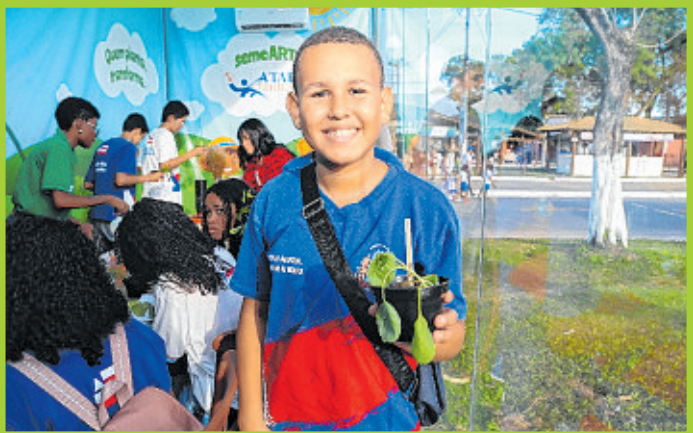
Alunos de escolas municipais e estaduais participaram da oficina de plantio Semearte