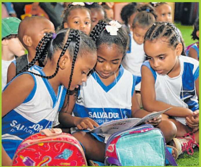
Escolas da rede pública tiveram programação especial ao longo da Fenagro 2025