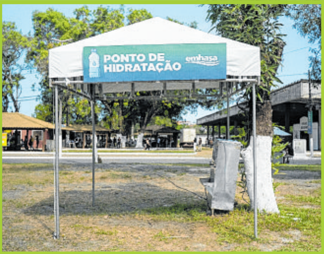
Embasa montou ponto de hidratação no Parque de Exposições de Salvador