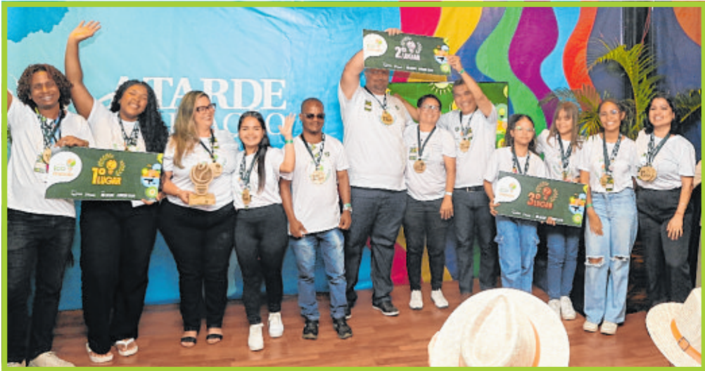
Alunos vencedores comemoram na cerimônia do Ecolnovar, que premiou propostas inovadoras e sustentáveis