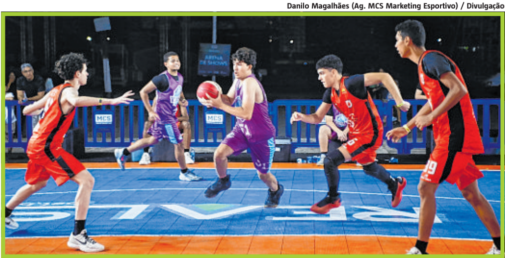
Campeonato Baiano de Basquete 3x3 e os Jogos Universitários Baianos (Juba): novas emoções na Fenagro