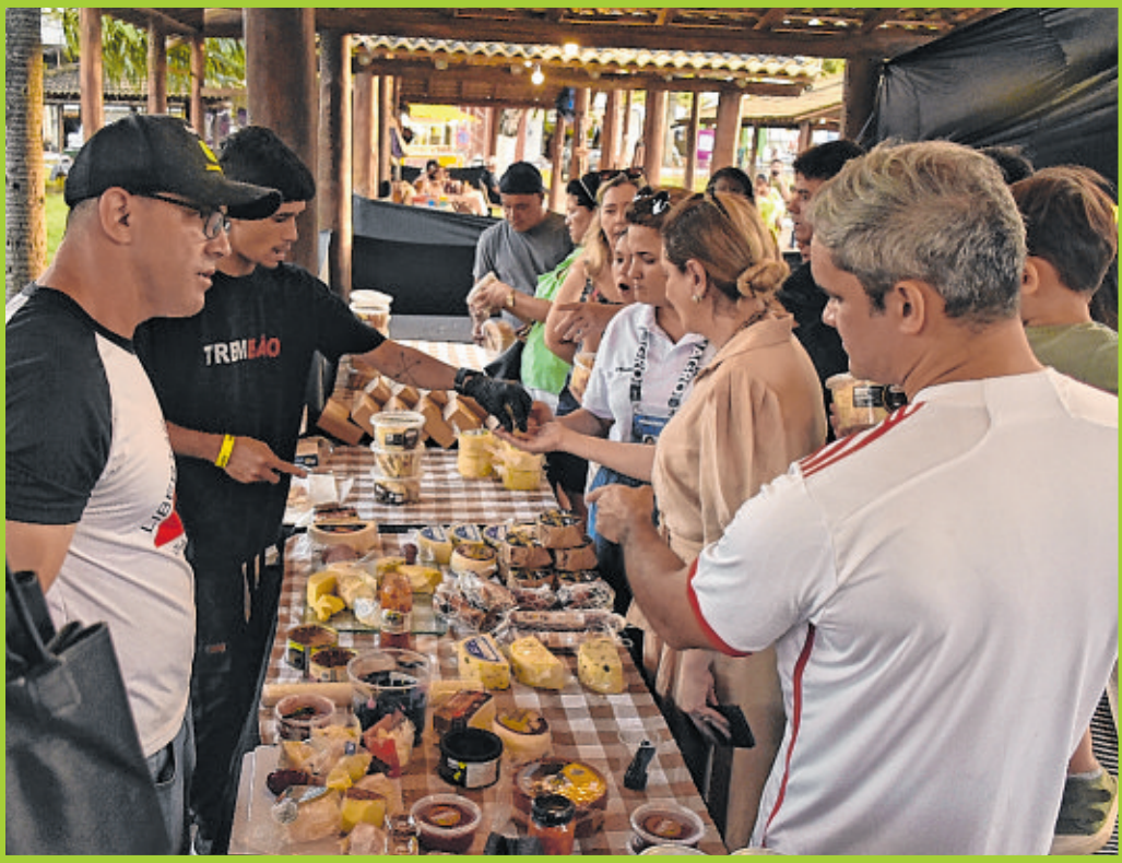
Degustação de queijos, doces e iguarias da Serra da Canastra: cantinho das delícias na feira

clientes ao estande, cujo diferencial foi a variedade de opções. Já o grupo Motopema demonstrou suas novidades em modelos de motos Honda e tratores LS Tractor, com ofertas exclusivas. Voltado para o público da cidade e do interior, o estande contou com equipe de especialistas para atender os visitantes e demonstrar seus produtos. Focada em soluções para o trabalho no campo, a Módulo Tratores também brilhou no segmento de máquinas agrícolas, com condições especiais para produtores rurais. Representante da marca New Holland, o estande promoveu apresentações práticas para demonstrar a evolução dos equipamentos.