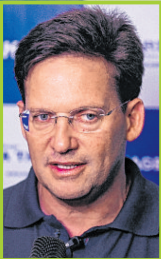
João Roma, ex-ministro da Cidadania