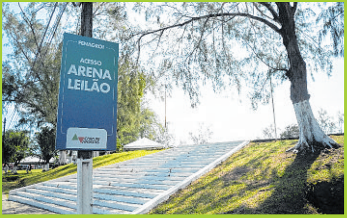
Casa de Apostas marcou presença na Arena Leilão da Fenagro no Parque de Exposições