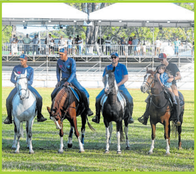
Desfile de animais premiados foi uma das atrações da abertura da Fenagro