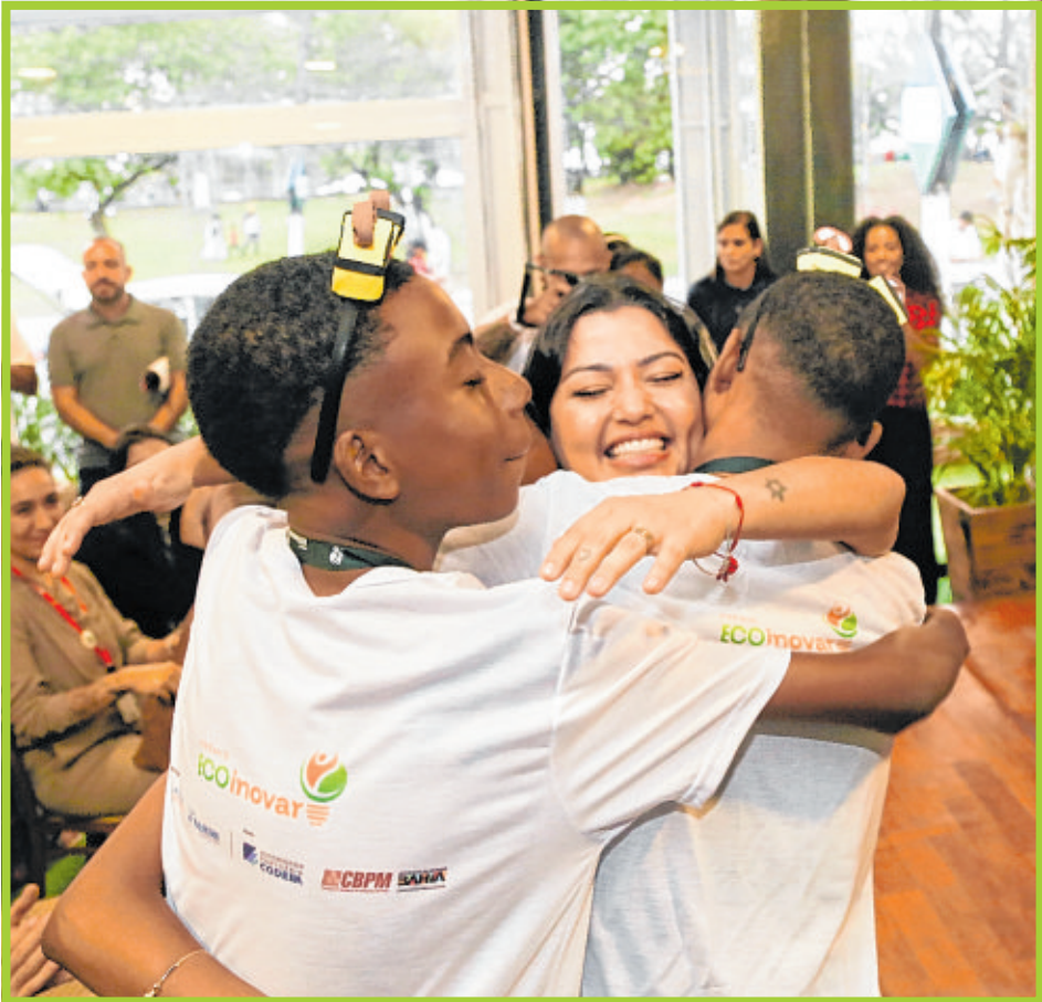
Ecolnovar: ação do A TARDE Educação reforça o protagonismo juvenil e a construção coletiva de soluções ambientais

Para ela, o saldo é de expansão e continuidade. “Saímos desta edição com convicções fortalecidas e possibilidades ampliadas. Cada atividade, cada jornal produzido, cada muda replantada revela a potência transformadora do trabalho que realizamos nos municípios ao longo de todo o ano. Entramos em 2026 determinados a ampliar alcance, aperfeiçoar entregas e fortalecer parcerias que acreditem no poder da educação. Seguimos abrindo caminhos, cultivando aprendizagens e construindo futuros possíveis”, concluiu.