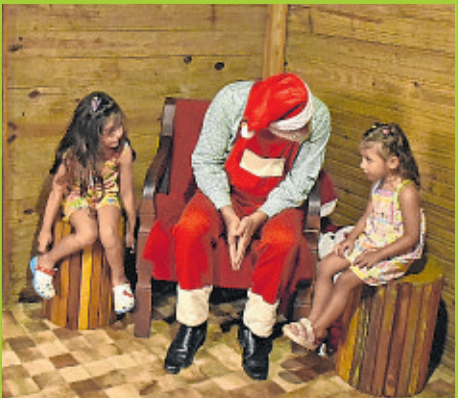
Houve longas filas para a Casa do Papai Noel, um dos espaços mais queridos da Fenagro