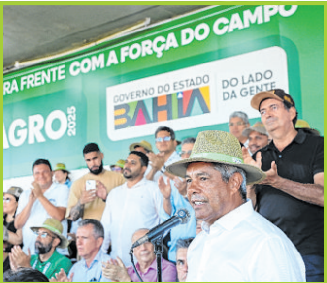
Governador Jerônimo Rodrigues discursa na solenidade de abertura da Fenagro