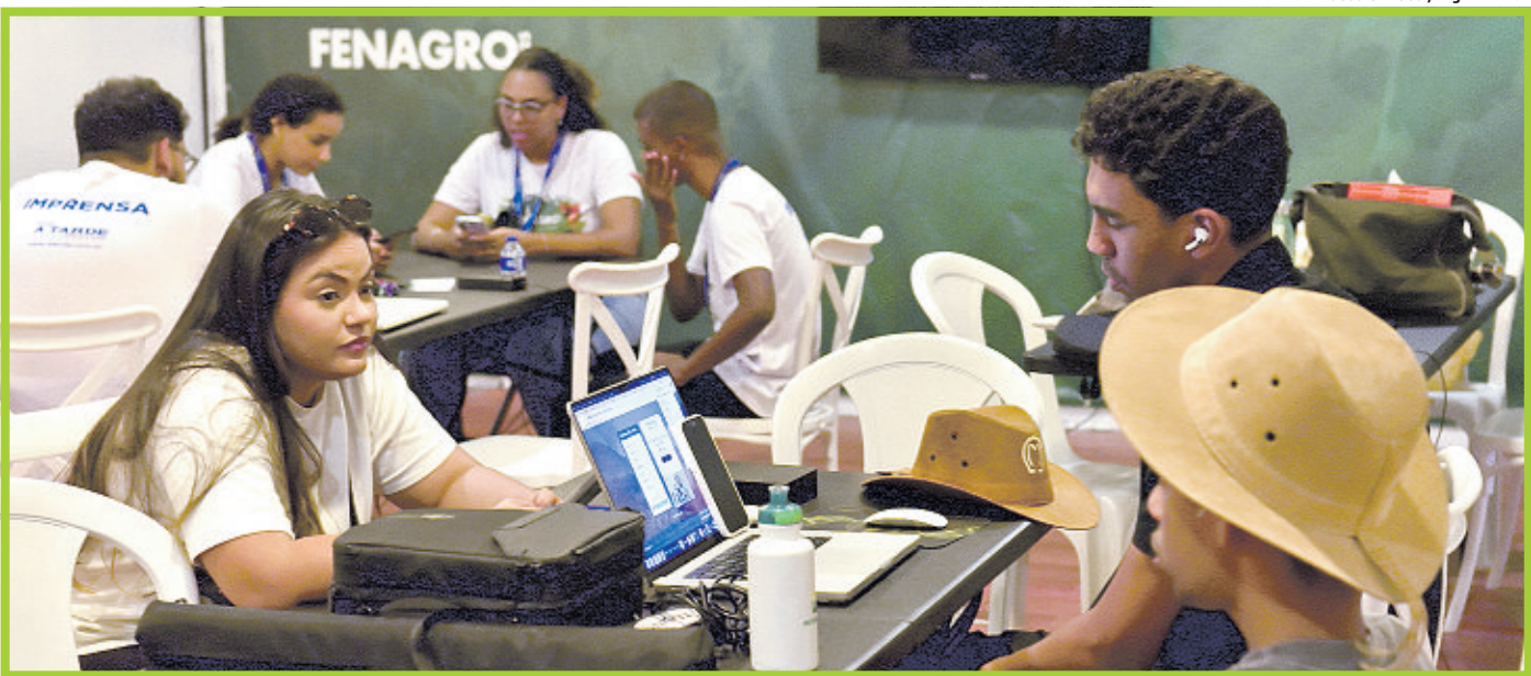
Um dos núcleos de produção de conteúdo montados na Casa A TARDE para contemplar a grande cobertura da Fenagro 2025, com veiculação em todas as plataformas digitais e impressas do Grupo de comunicação