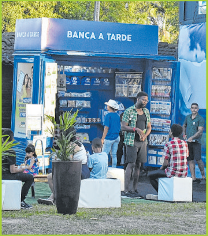
Com a banca, Grupo A TARDE estreitou vínculo com os leitores