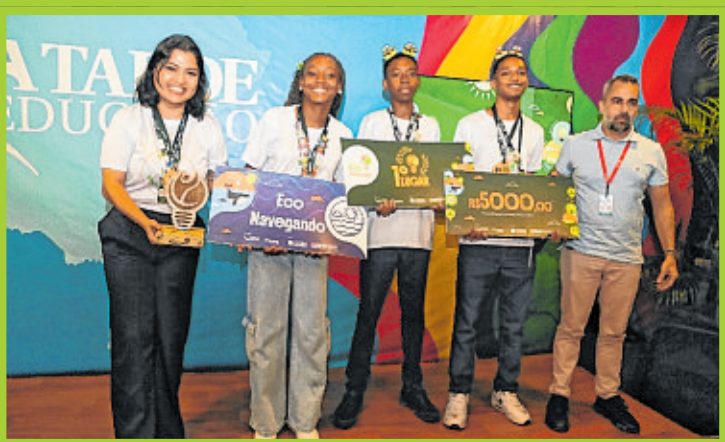
Prêmio Ecolnovar contemplou vencedores em duas categorias: Eco-Terra e Eco-Navegando