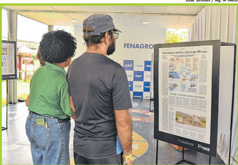
Público adulto também teve contato com o acervo do Centro de Documentação e Memória A TARDE – Cedoc