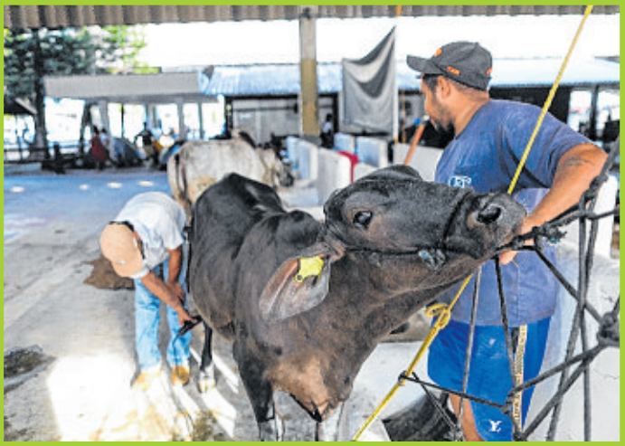
Exemplar da raça Girolando: Fenagro é vitrine importante para animais