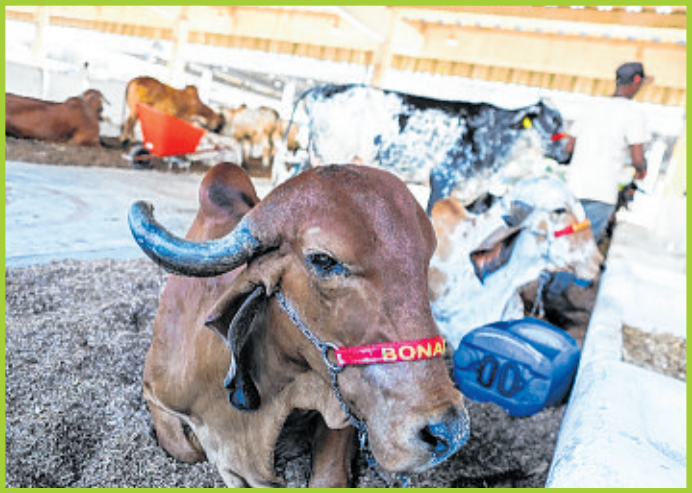
Animais da raça Gir Leiteiro se destacaram ao longo das competições