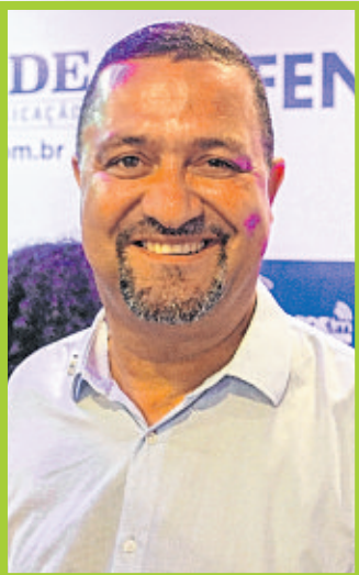
Osni Cardoso, secretário estadual de Desenvolvimento Rural