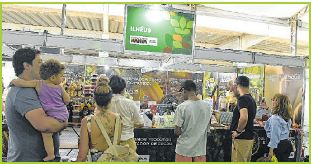
Ilhéus levou à feira produtos diversificados à base de cacau e de cupuaçu, como licores, geleias e chocolate