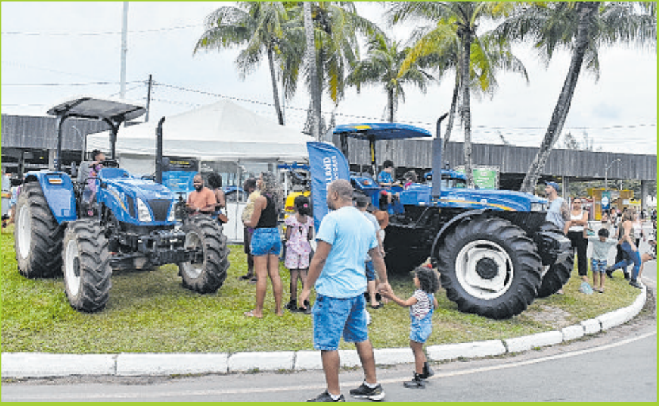
Tratores da New Holland atraíram crianças e adultos no Parque de Exposições