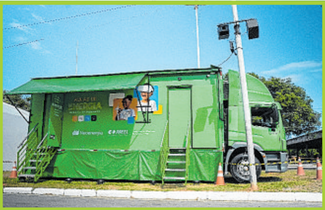
Caminhão da Neoenergia Coelba: prestação de serviços aos visitantes