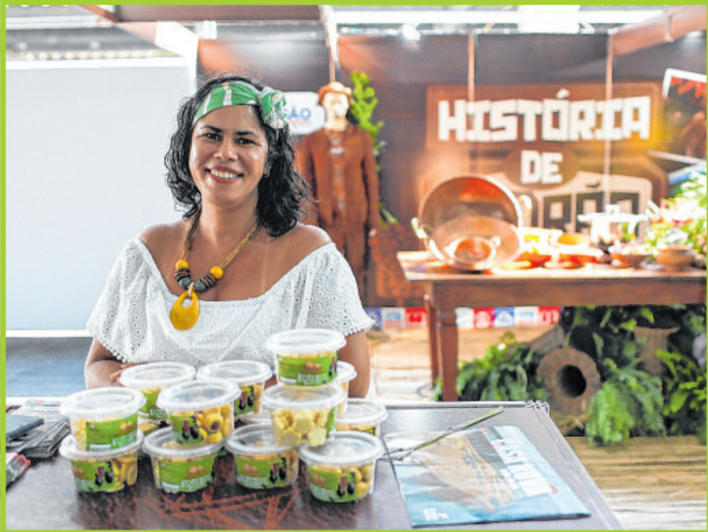
Município de Pedrão levou história e representatividade à Feira das Feiras, com direito aos Encourados