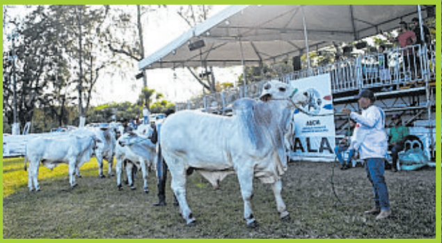
Animais da raça Nelore são muito valorizados nas edições da Fenagro