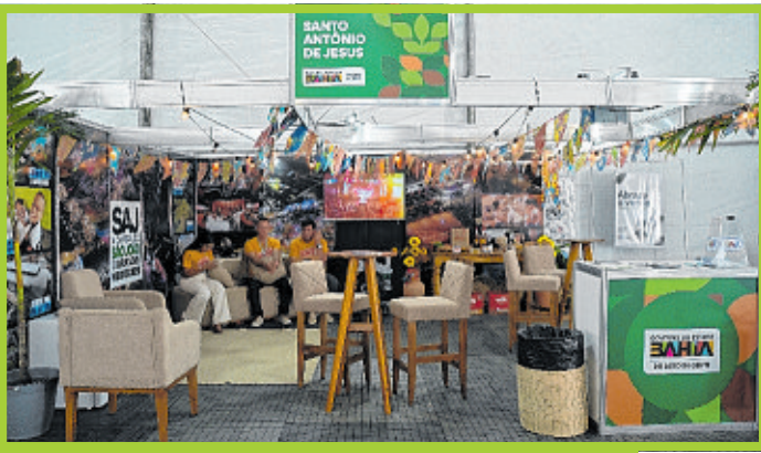
Santo Antônio de Jesus levou o tema 'Destino SAJ: capital de grandes negócios' à feira