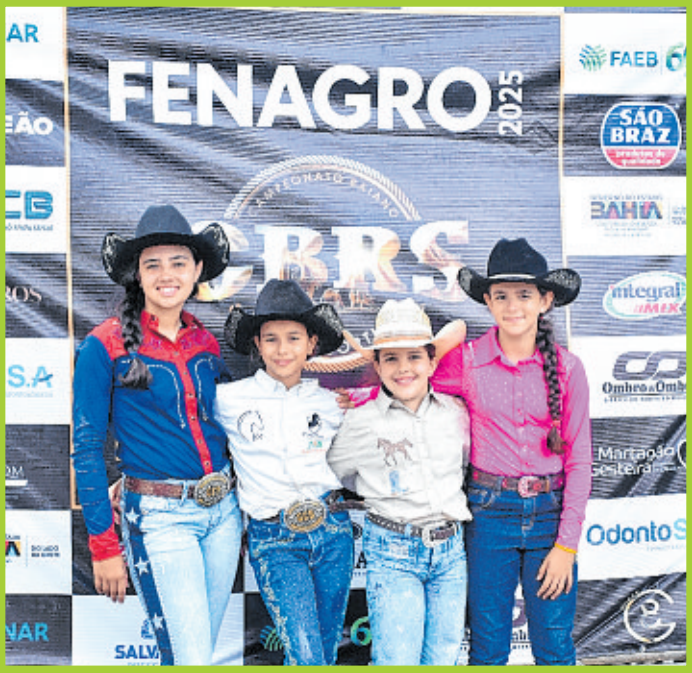
Adolescentes e crianças também marcaram presença e se divertiram na Arena de Esportes