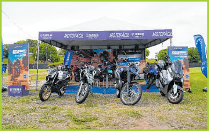
No estande da Yamaha, houve exposição de modelos que chamaram a atenção