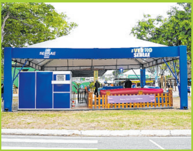
Sebrae: incentivo ao empreendedorismo, inovação e desenvolvimento do agro