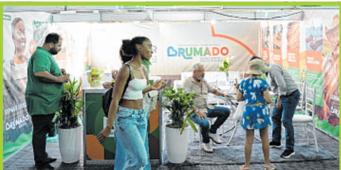
O 'umbu gigante' de Brumado foi um dos principais destaques da feira