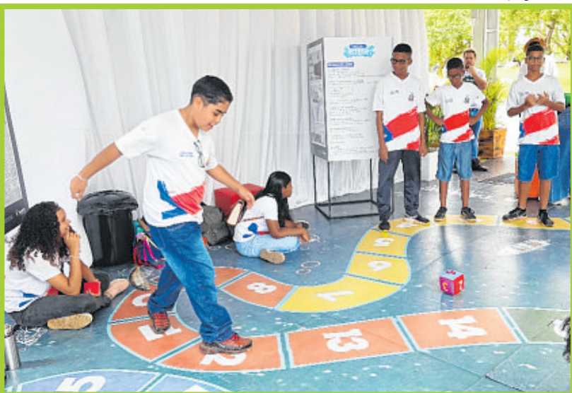
Participantes avançam no tabuleiro conforme respondem aos desafios propostos pelo jogo