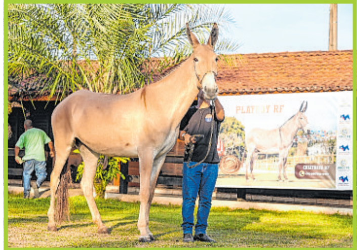
Mula Frika do Anaiti: cruzamento de cavalo Campolina com jumento Pêga