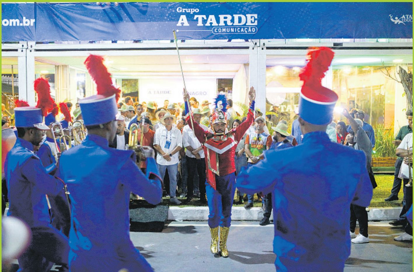
Casa ficou lotada no dia da abertura, com direito a exibição especial da fanfarra FANDUC