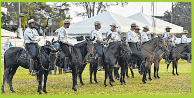
Registro do Campeonato Égua Junir de Marcha Picada