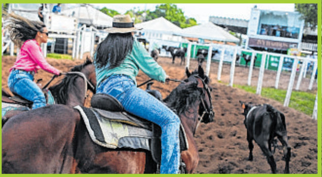
Competição feminina de Ranch Sorting na Arena de Esportes da Fenagro