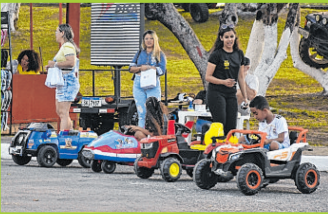
Touro mecânico, carrinhos e parque: não faltou diversão para os pequenos que visitaram a Fenagro