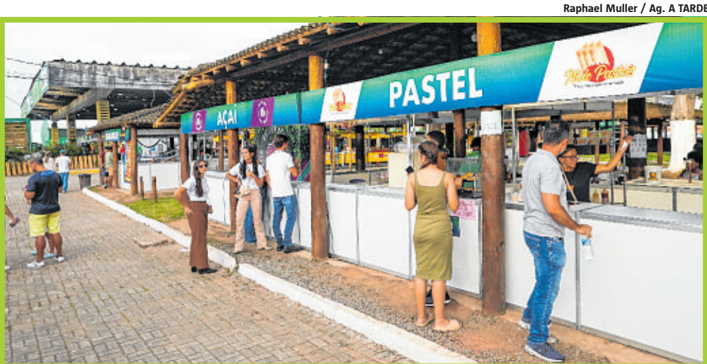
Pastéis, sanduíches 'gourmet', açaí, churrasco e refeições diferenciadas: não faltou nada para agradar o paladar