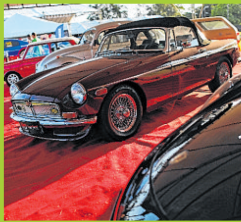
Exposição de carros antigos foi uma atração à parte, com seus modelos icônicos e diferenciados