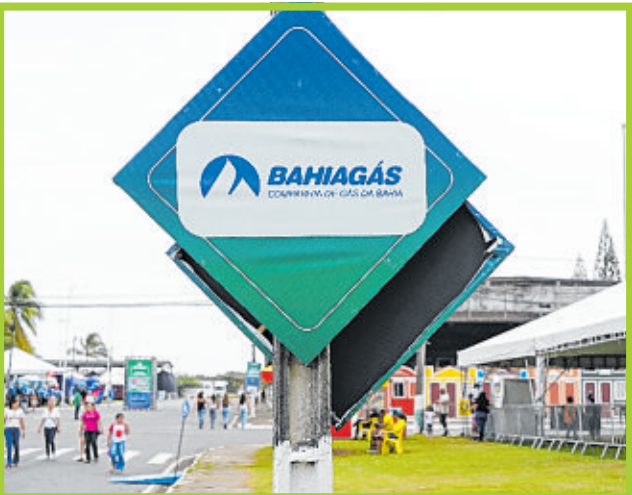
Bahiagás: marca forte de desenvolvimento associada à Fenagro 2025