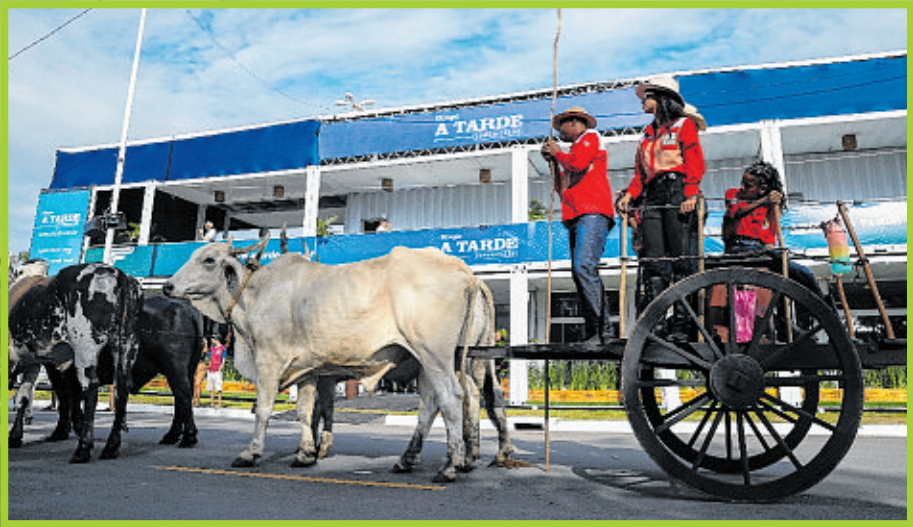
Carro de boi puxado por grupo de bois adestrados desfila em frente à Casa A TARDE para marcar o início da feira

“A Fenagro 2025 é mais do que uma feira — é um grande dia de parque para as famílias baianas”