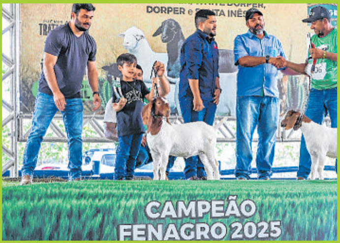
Caprinos da raça Boer na Exposição Rankeada da espécie