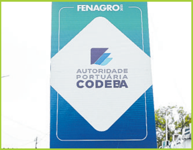
Codeba: importância do setor portuário para escoar a produção do agro