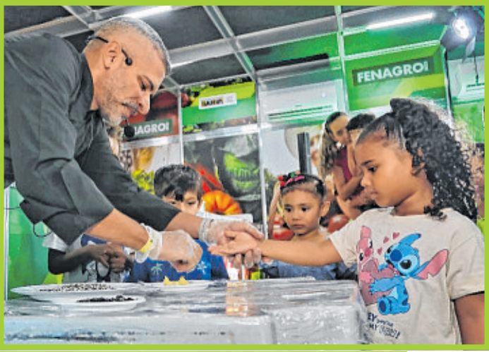
Cozinha Show: crianças entram em contato com alimentos e produção gastronômica