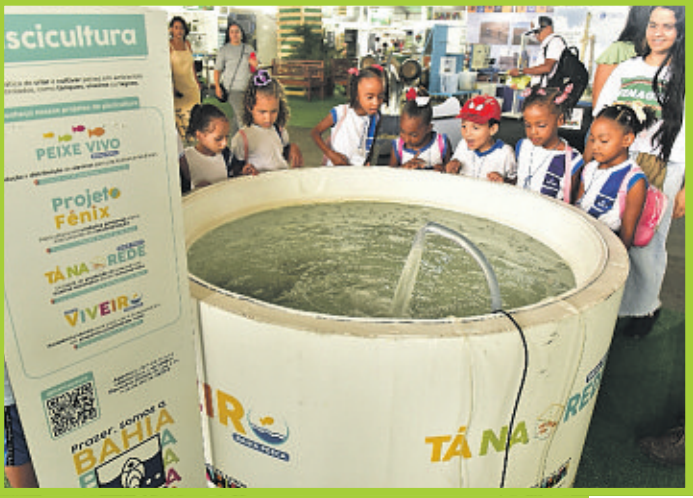
Estudantes puderam conhecer de perto exemplos de tanques de aquicultura da Bahia Pesca