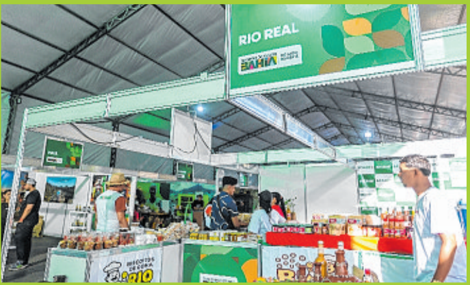
Produtos derivados da laranja fizeram sucesso no estande de Rio Real