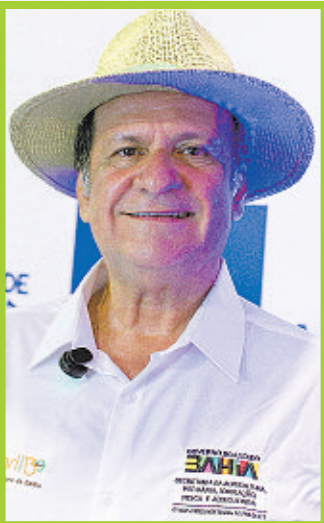
Maurício Bacelar, secretário de Turismo da Bahia