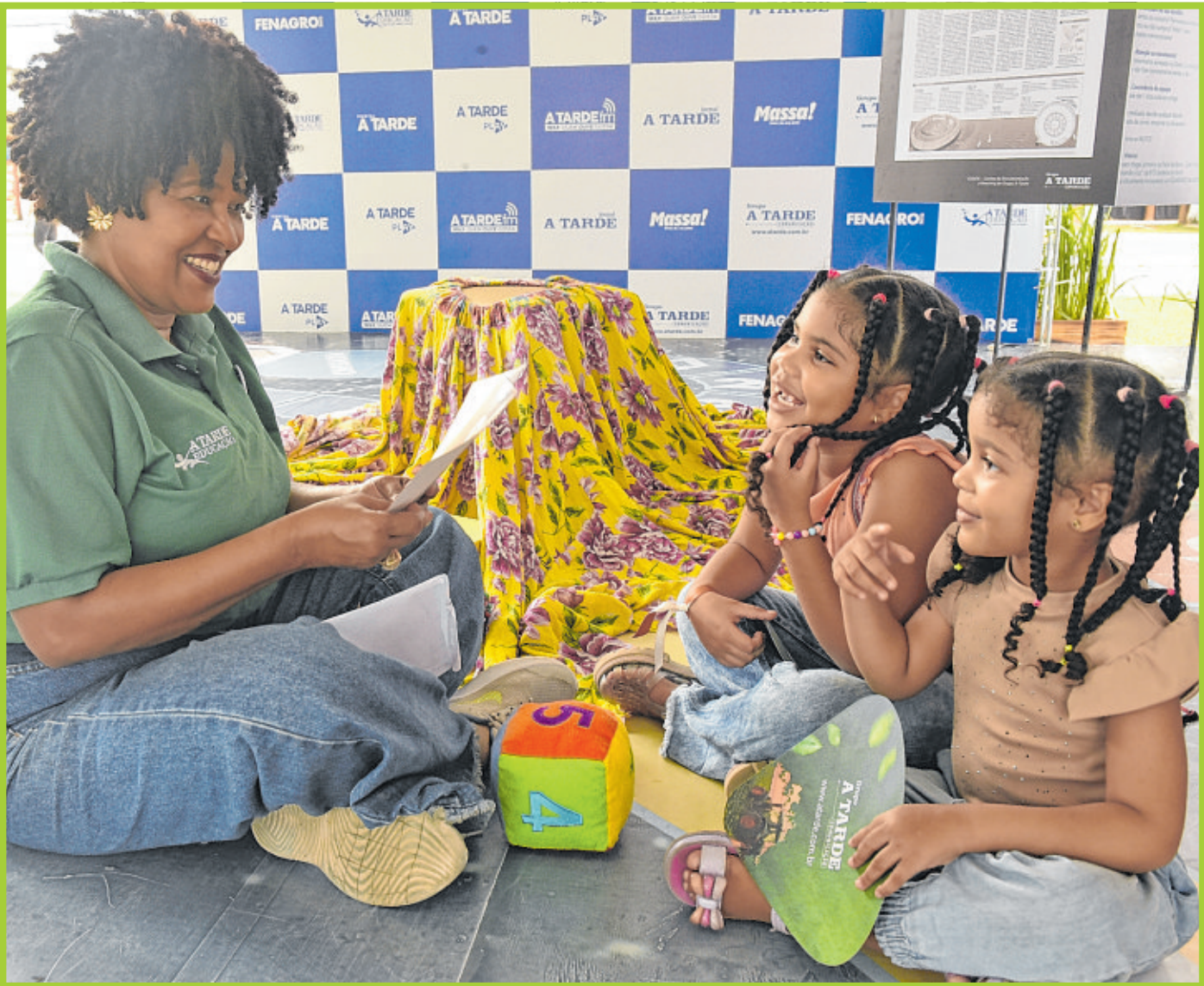
O jogo Mar de Histórias contemplava faixas etárias variadas: crianças menores divertiram-se com contação de histórias interativas e aprendizados lúdicos

Atividade lúdica foi desenvolvida pelo CEDOC e A TARDE Educação com base em material histórico do jornal sobre a Baía de Todos-os-Santos