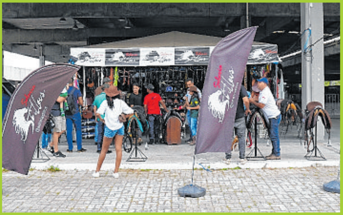
Selaria Ystillus: venda de acessórios de equitação movimentou a feira