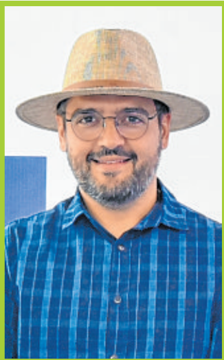
Valderico Júnior, prefeito de Ilhéus, cidade do sul baiano