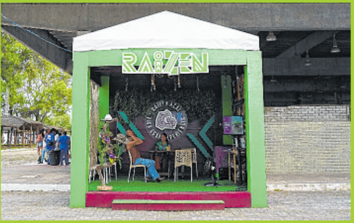
Raizen divulgou oportunidades na Fenagro 2025 para expandir sua rede