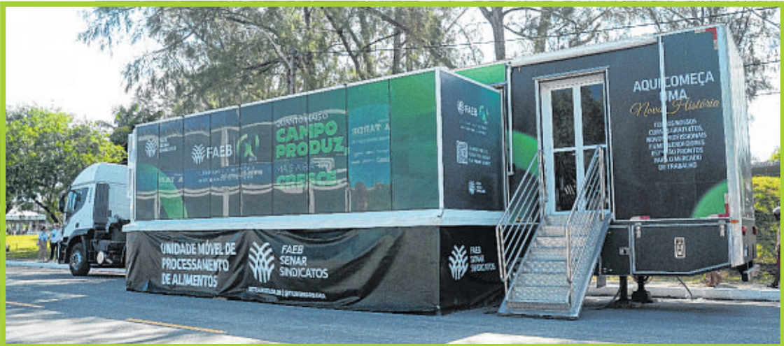
Sistema Faeb/Senar: capacitação na Carreta Escola do Senar