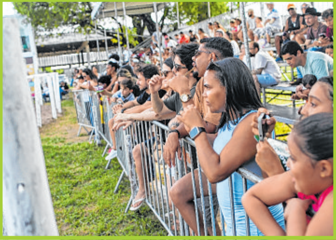
Público da Arena de Esportes prestigia espetáculo equestre de Ranch Sorting