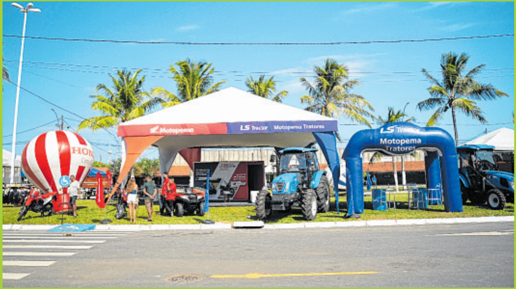
Motopemba: concessionária da Honda Motos que atua na Bahia desde 1996