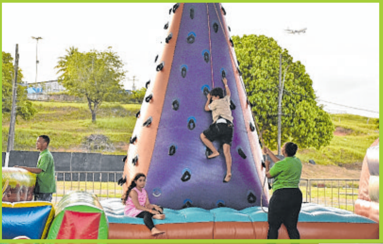
Escalada do Parque Inflável despertou o espírito aventureiro na garotada