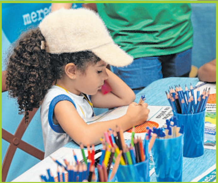
Crianças se divertem nas oficinas criativas do A TARDE Educação na feira agropecuária