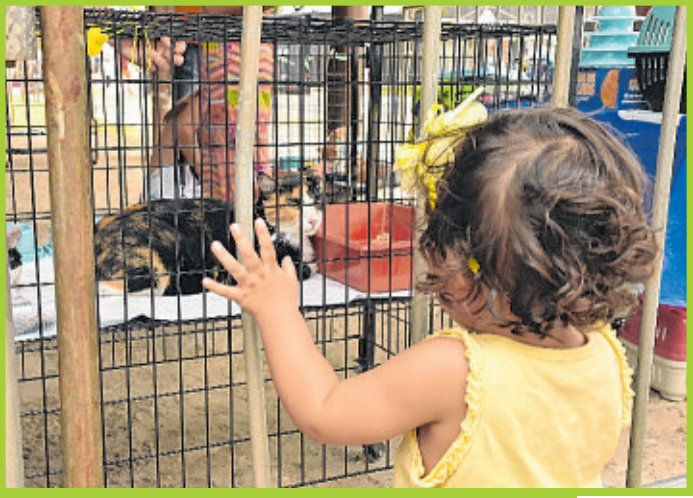
Feira de adoção de cães e gatos encantou o público infantil e adulto na Fenagro