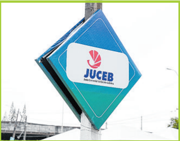
Junta Comercial da Bahia (Juceb) ofereceu serviços e novidades na feira