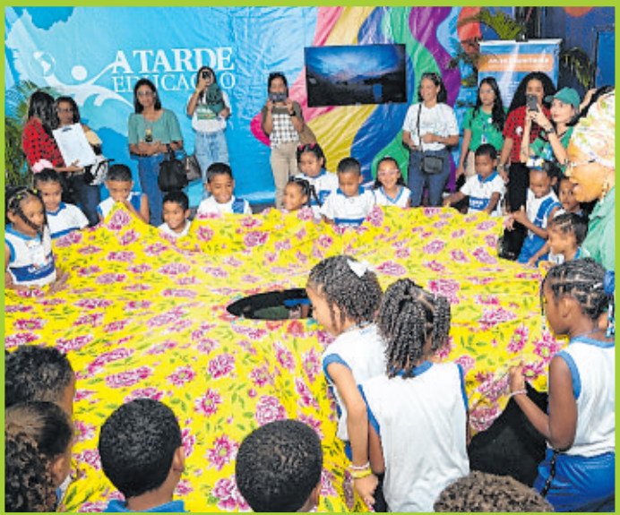
Educadores promovem atividade de integração dos estudantes no evento