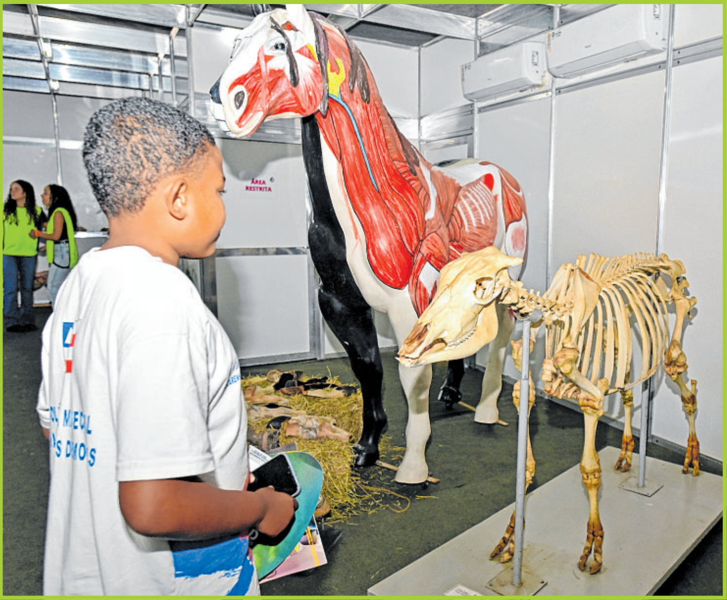
Museu de Anatomia Animal, uma das grandes atrações da Fenagro, atraiu público recorde