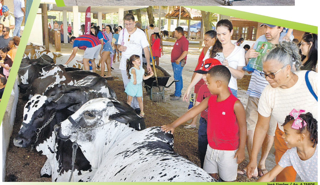
José Simões / Ag. A TARDE