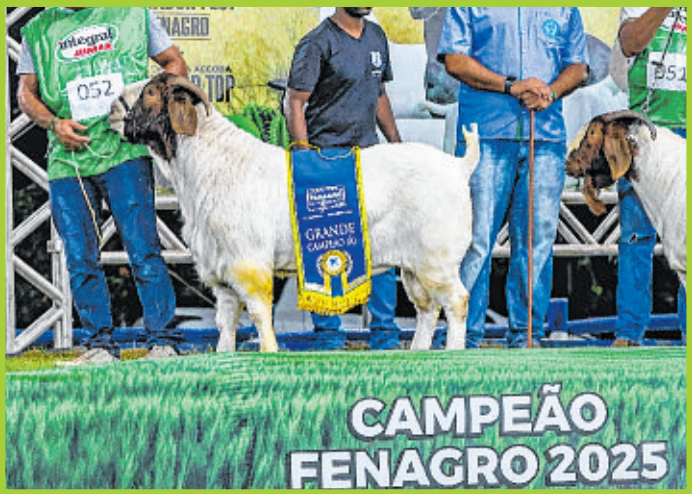
Grande campeão caprino da raça Boer – Fazenda Caprinos Victoria