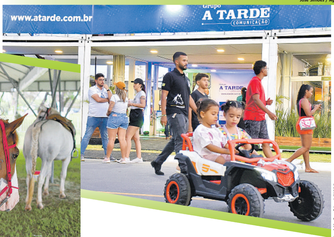
José Simões / Ag. A TARDE