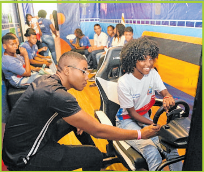
Sala Gamer ofereceu jogos educativos e interativos que uniram tecnologia e trânsito