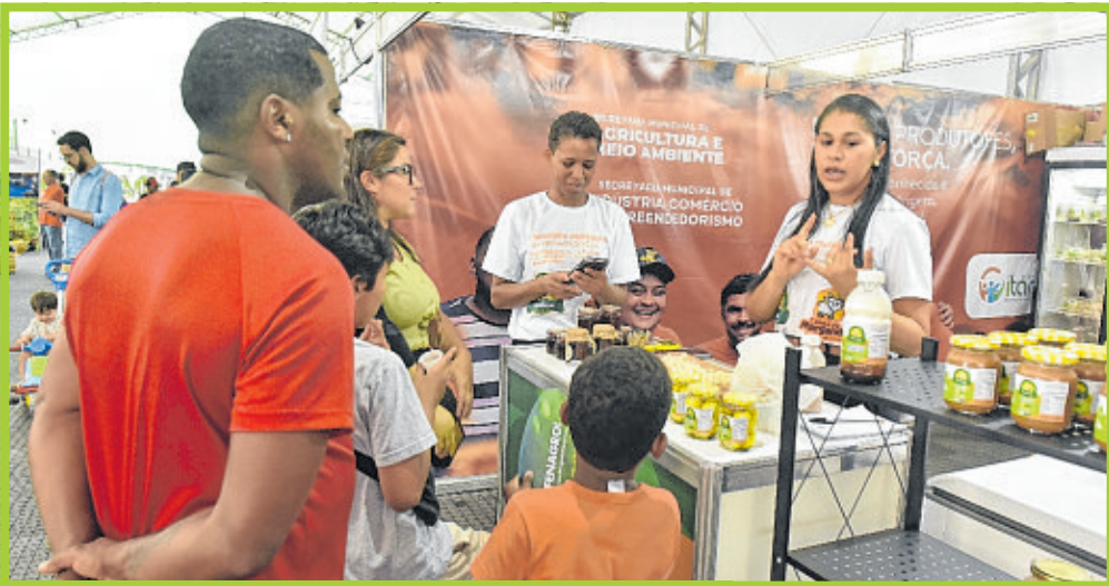
No estande de Itanagra, produtos artesanais derivados do leite de cabra foram o carro-chefe