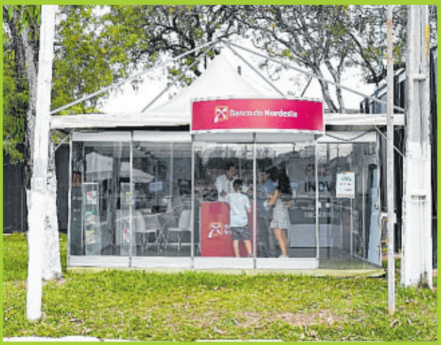
Banco do Nordeste (BNB): linhas de crédito para grandes e pequenos produtores