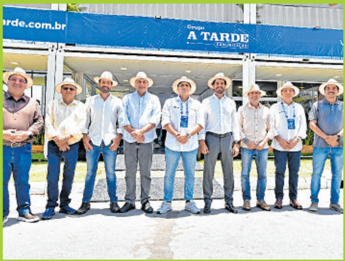
Comissão de Agricultura da Aiba é recebida pela direção do Grupo na Casa A TARDE